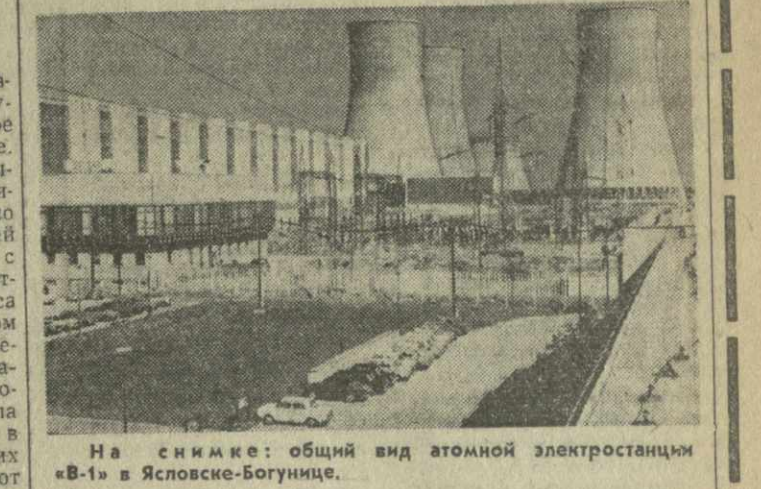
На снимке: общий вид атомной электростанции «В-1» в Яслоске-Богунце.