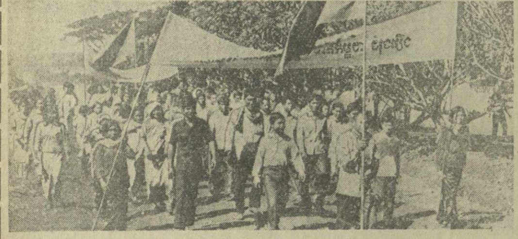
На снимке: в освобожденных районах страны проходят массовые митинги населения и бойцов революционной армии...