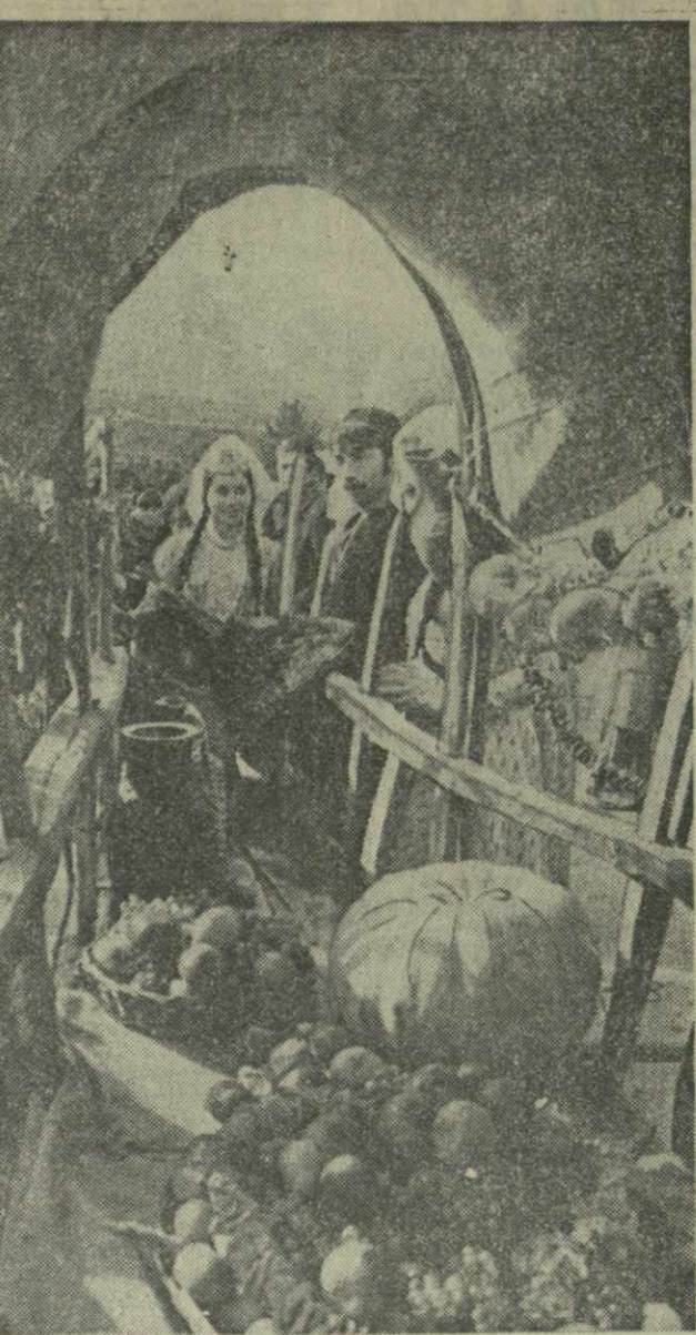
«МРАВАЛЖАМИЕР».

Премия Нурека — Нодару Думбадзе Новый роман Нодара Думбадзе «Заново вечно» удостоился в 1978 году премии Нурека. Книжка в единственном экземпляре передана автору по случаю его 60-летия. Творческое сотрудничество строителей Нурской ГЭС и писателя страны началось три года назад, тогда по инициативе работников Центральной городской библиотеки Нурской ГЭС в здании стали поступать книги с дарственными надписями известных поэтов и прозаиков. Книжки с своими автографами писали Михаил Шолохов, Константин Симонов, Алексей Суриков Юрий Бондарев и другие мастера художественного слова. Среди книг были и три тома избранных произведений Нодара Думбадзе. По сообщению корреспондента «Заря Востока» и Грузинформ.