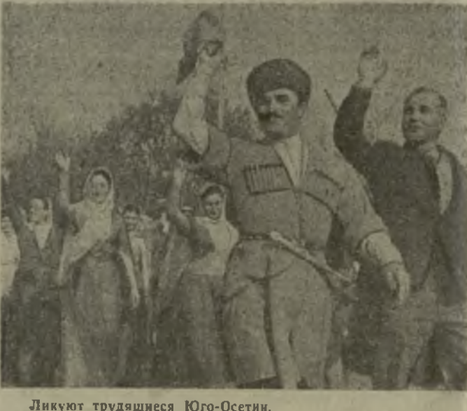
Ликуют трудящиеся Юго-Осетии.

Грузинской ССР и Совпрофа Грузии, завоеванное автозаводами в социалистическом соревновании в честь 50-летия Великой Октябрьской революции.