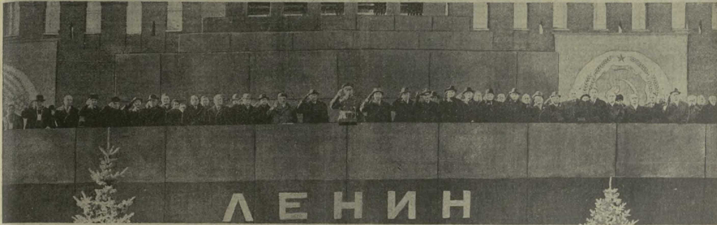
Празднование 50-летия Великой Октябрьской социалистической революции в Москве.

Октябрьские торжества вновь демонстрируют всему миру нерушимое единство партии и народа.