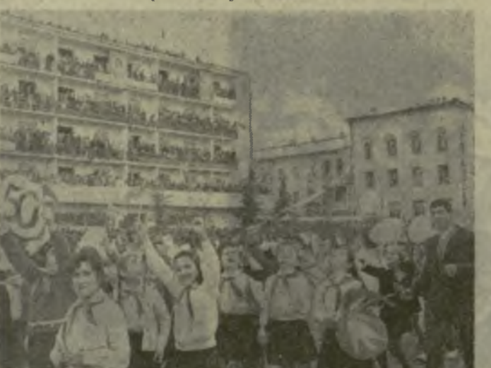
Горийские пионеры на праздничной демонстрации.