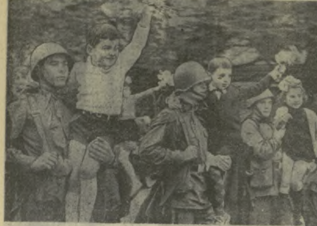
7 ноября 1967 года. Тбилиси. На снимке: в праздничной колонне демонстрантов.