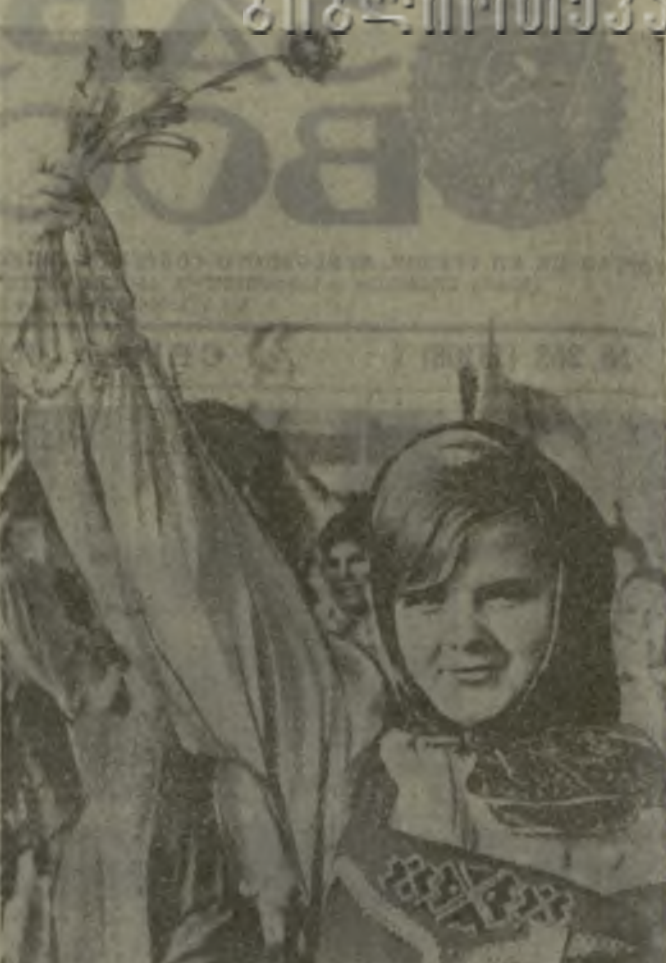
На снимке: демонстрация представителей трудящихся на Красной площади.

«Братский привет мужественному вьетнамскому народу, ведущему героическую борьбу против агрессии».