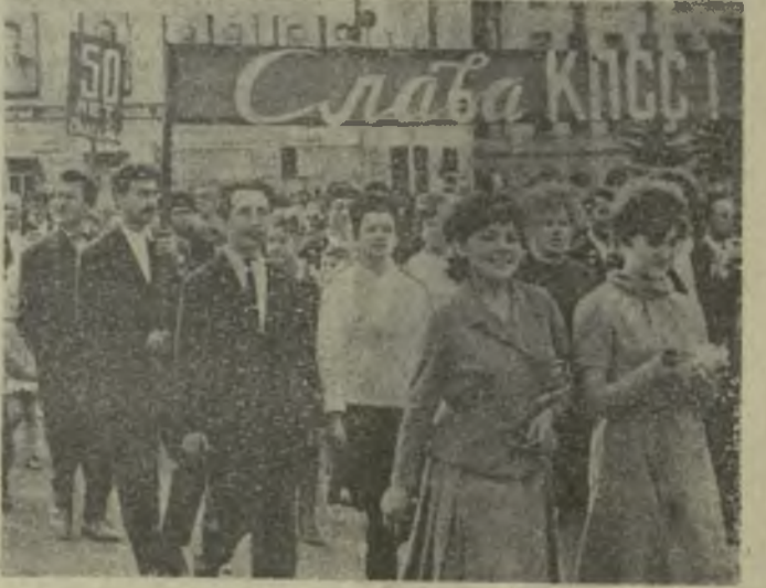
«Слава КПСС» — провозглашают кутаисцы.

В сообщении отмечается красочный характер военного парада, на котором демонстрировались как образцы оружия 1917 года, так и современное вооружение Советской Армии, ее мощная ракетная техника.