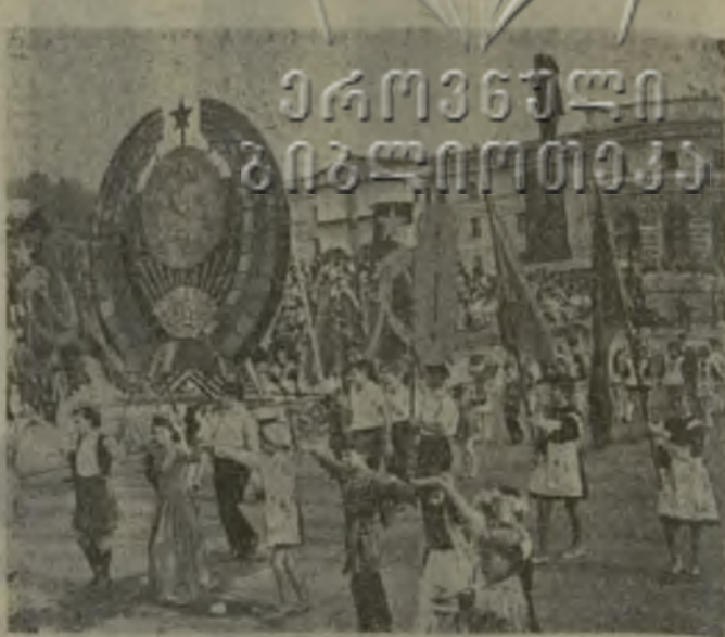
Праздничное шествие в Сухуми.

Более четырех часов длилось праздничное шествие кутаисцев.