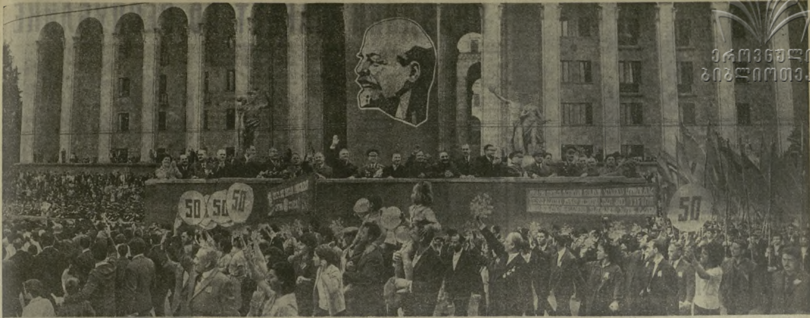
Празднование 50-летия Великой Октябрьской социалистической революции в Тбилиси. На снимке: трибуна у Дома правительства Грузинской ССР. Проходит демонстрация трудящихся.