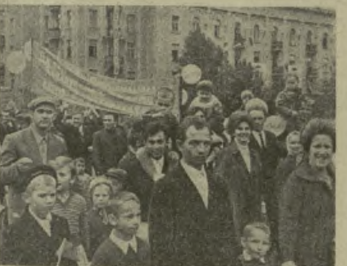
Колонна демонстрантов в Рустави.