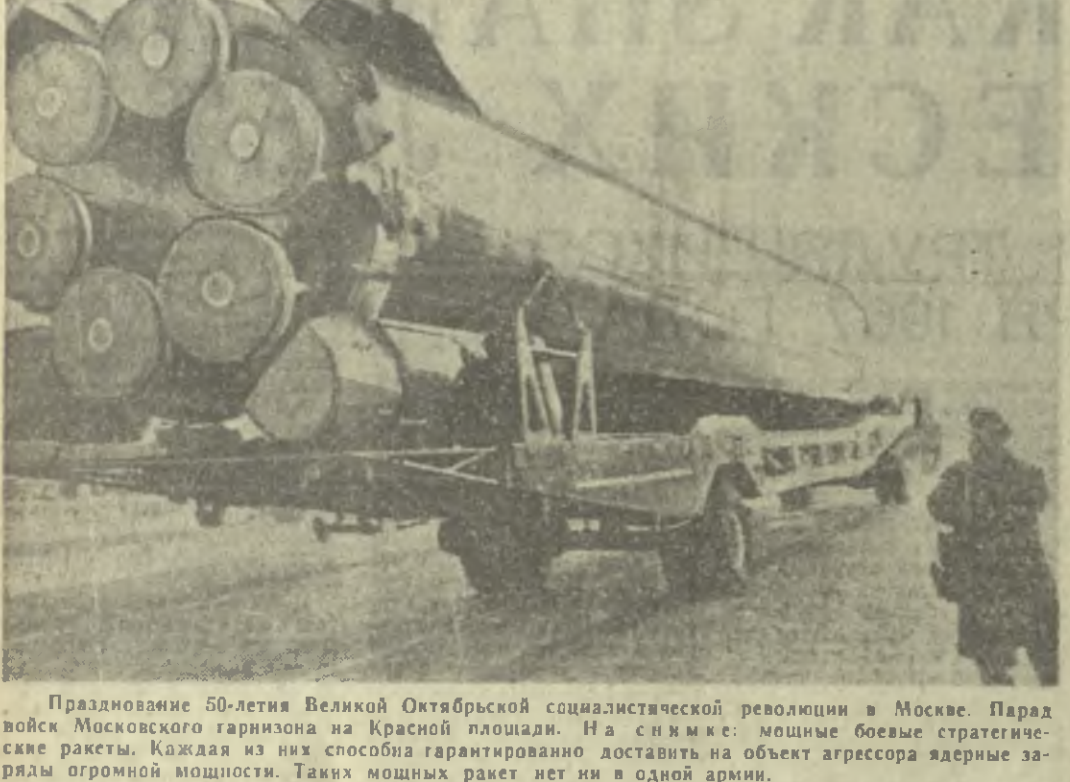
Празднование 50-летия Великой Октябрьской социалистической революции в Москве. Парад войск Московского гарнизона на Красной площади. На снимке: мощные боевые стратегические ракеты. Каждая из них способна гарантированно доставить на объект агрессора ядерные заряды огромной мощности. Таких мощных ракет нет ни в одной армии.

«Пусть крепнет и развивается солидарность советского народа с народами арабских стран, борющимися против посягательств империализма за ликвидацию последствий империалистической агрессии».