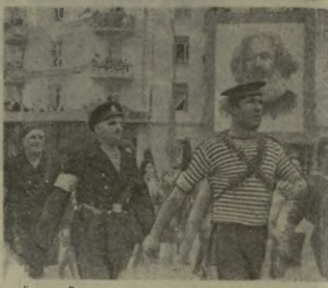
Батуми. Воскрешая страницы истории...