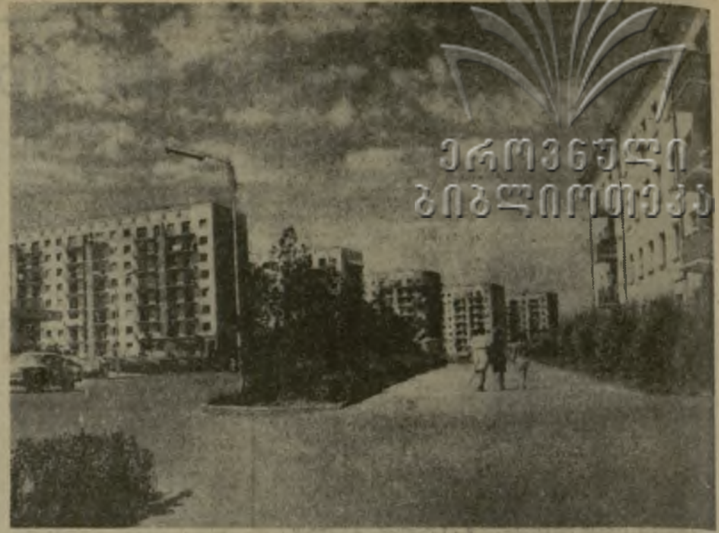
С каждым годом хорошеет город грузинских химиков и металлургов Рустави. На снимке: одна из новых магистралей города — проспект Дружбы народов.

Половина суммы от реализованных билетов автотолотереи поступит на дальнейшее укрепление оборонной мощи Родины, дальнейшее развитие массовой спортивной работы среди населения, военно-патристическое воспитание трудящихся, на строительство учебных центров, школ, спортивных сооружений.