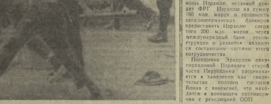
США. 10 тысяч студентов приняли участие в демонстрации, состоявшейся у правительственного здания в городе Окленде (штат Калифорния).