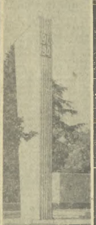
Обелиск памяти погибших в Великой Отечественной войне, воздвигнутый в горах Махарадзе.

Хороший нынче урожай в Аджарии. Особенно обильно усыпаны плодами деревья в Цихездзирском совхозе. Здесь с гектара рассчитывают получить до 20 тонн мандаринов, а всего сдать государству тысячу тонн золотистых плодов.