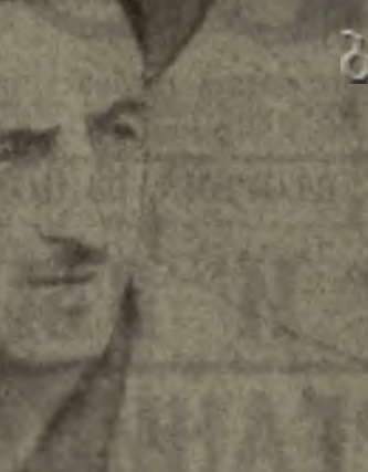
На сессии районного Совета депутатов трудящихся за последние годы стал смелее искать новые, более совершенные формы и методы работы, глубже и серьезнее вникать в экономику сельскохозяйственного производства, заниматься такими насущными проблемами, как рентабельность хозяйства, материальная заинтересованность в развитии, общественное производство, внутрихозяйственный расчет.