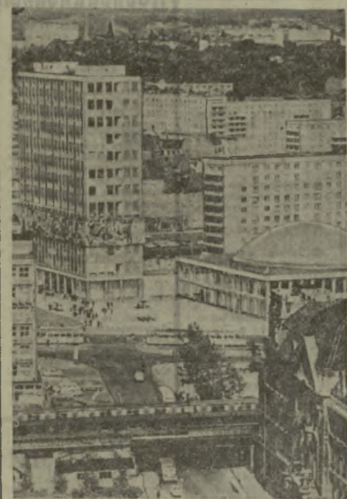
Берлин. В центре — Дом учителя, справа — Зал съездов.

Видный немецкий писатель Генрих Манн, находясь в изгнании как антифашист, опубликовал сборник культурно-политических статей под названием «Век подвергается осмотру».