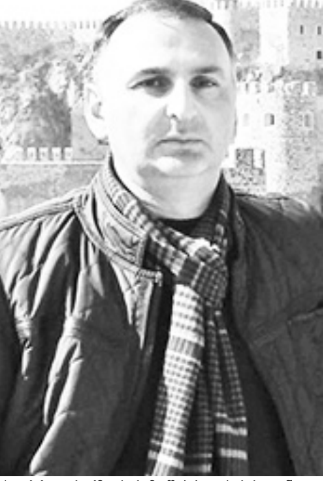
საარქივო საქმეების მოწესრიგებას სათანადო ყურადღებას არ აქცევენ...