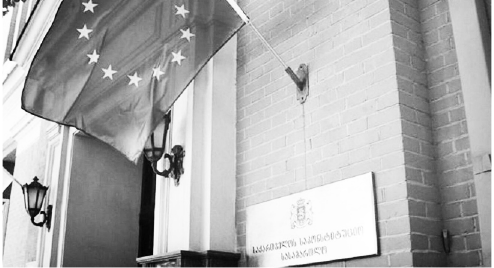
საკონსტიტუციო სარჩილი საქართველოს პარლამენტის არჩევნების მომწესრიგებელი ნორმებისა და ამ ნორმების საფუძველზე ჩატარებული 2024 წლის 26 ოქტომბრის