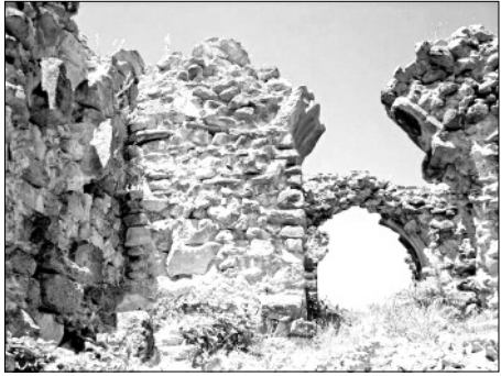
„არს მთის კალთას, სკანდას, სასახლე მეფეთა და ციხე დიდი, დიდშენი“ პანსუპტი პაპრატიონი

Facebook გაზეთი თერჯოლა www.nplg.gov.ge www.terjola.gov.ge