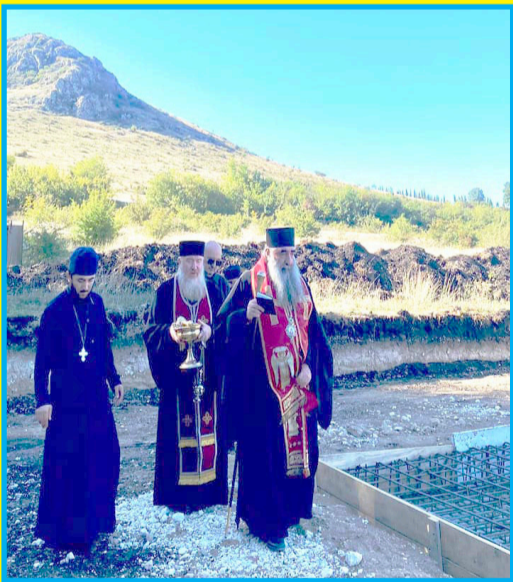
შეუძლია საკუთარი წვლილი შეიტანოს ამ კეთილშობილ საქმეში“.

ქალაქ დედოფლისწყაროში ელისა მთაზე კიდევ ერთი ეკლესია აშენდება. როგორც ხორნაბუჯისა და შერეთის ეპარქიაში გაზეთ „შირაქს“ განუცხადეს, ახალი ტაძარი ელისა მთის კალთაზე, ნაძვნართან, სასაფლაოს მიმდებარე ტერიტორიაზე შენდება, რომელიც ჯვართამაღლების სახელობის იქნება.