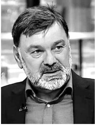
გვესაუბრება „ერთიანი ნეიტრალური საქართველოს“ ერთ-ერთი დამფუძნებელი, ეკონომისტი და პოლიტიკოსი ბიძინა ბიორბოიანი

— ბატონო ბიძინა, საპარლამენტო არჩევნებიდან სამ კვირაზე მეტი გავიდა. როგორ შეაფასებთ, არსებულ რეალობას?