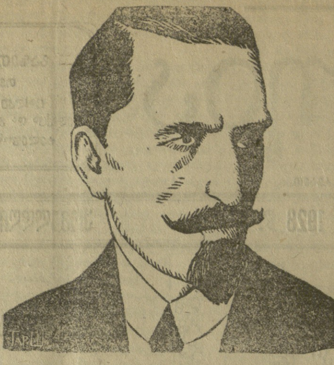
პროფ. გავრ. ჯავახიშვილი.

მისი მთავარი შრომები: 1. საქართველოს ეკონომიური ისტორია 1 ნაწ. 2. ქართველ ერის ისტორია 1 და 2 ტომი. 3. ისტორიის მიზანი და მეთოდები 1 წიგნი. 4. ქართულ სიმართლის ისტორია 1 ნაწილი. 5. საქართველოს საზღვრები. 6. დამოკიდებულება საქართველოსა და რუსეთს შორის მე-18 საუკუნეში. 7. სამოქალაქო წყობილება მე-18 საუკუნეში საქართველოში. გარდა ამისა მრავალი შრომები აქვს გამაზღვებული, მაგრამ დაუბეჭდავია დღემდის უსახსრობის გამო.