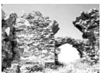
„არს მთის კლთას, სკანდას, სასახლე მევეთა და ციხე დიდი, დიდშენი“ პანსუპტი პაპრატიონი

პრეზიდენტის ჩვენი გაზეთის გამოცემა მომავალი 2025 წლისათვის!