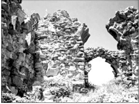
„არს მთის კლთას, სკანდას, სასახლე მევეთა და ციხე დიდი, დიდშენი“