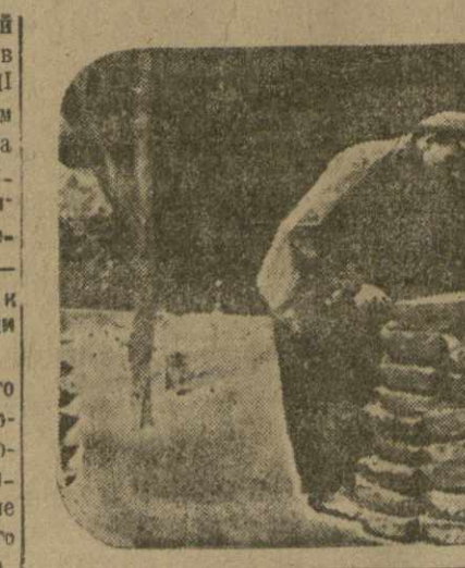
КАФАН. Медный комбинат. Проверка качества литья

Можно отметить, что в работе канцелярии комбината наблюдается тенденция к бюрократизму и канцеляризму. В первую очередь к работе канцелярии комбината. В первую очередь к работе канцелярии комбината. В первую очередь к работе канцелярии комбината.