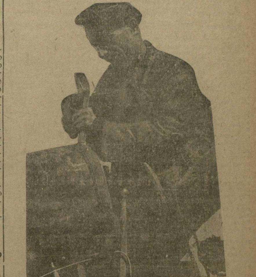
Ремонт тракторов в Горькой МТС.