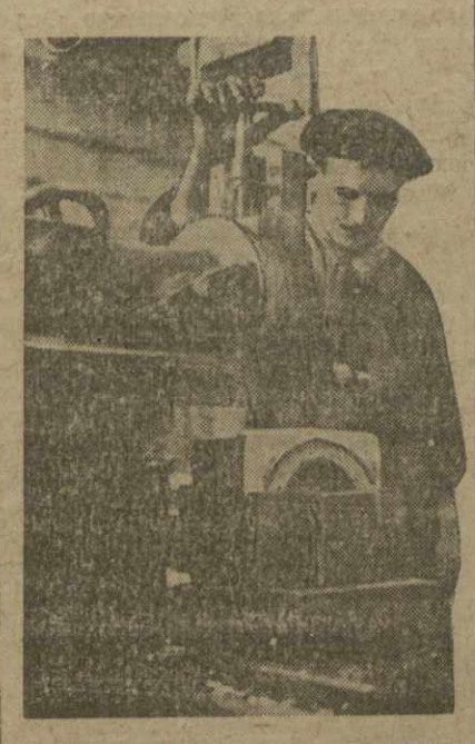
Дело-Тифлис Оточно паровозных подшильников

чальник станции — человек новый. А заместитель начальника станции тов. Хуци, давно уже переброшенный на эту станцию как специалист, чаще всего безомоночно разводит руками и ссылается на объективные