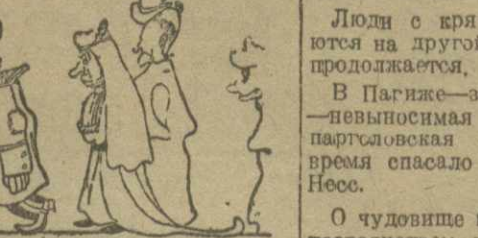
и он идет впереди профессора в нарядном мундире.

В Каспийском море оторвавшаяся льдина унесла в устье моря 16 рыбаков. Судьба их, ха-ха, неизвестна.