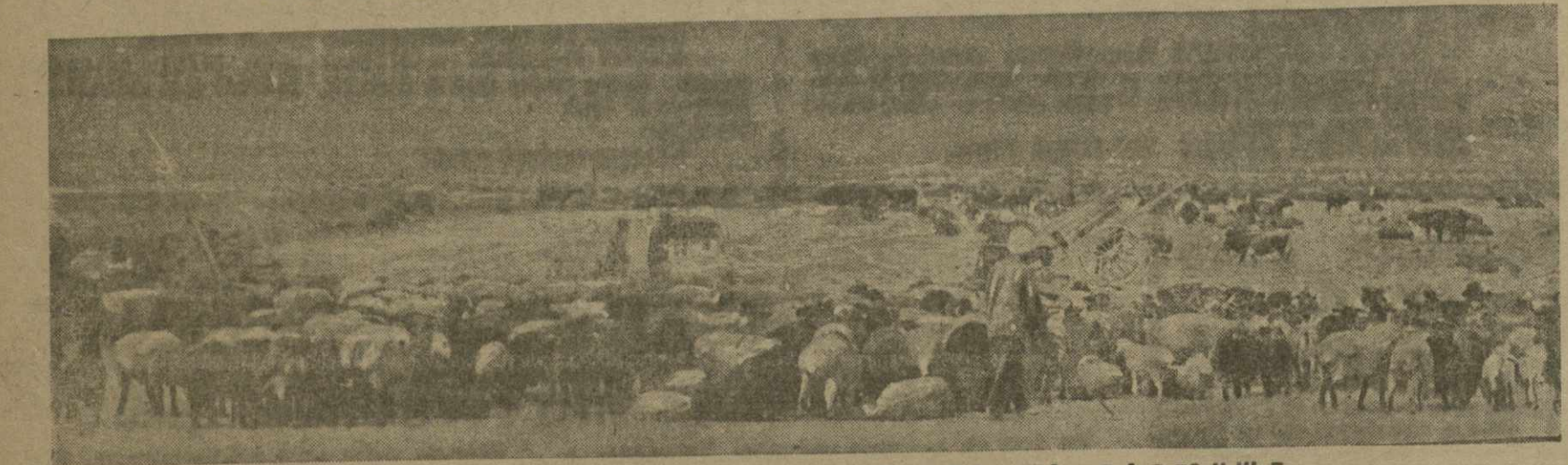
КАЗАХСКИЙ РАЙОН. БАРАНТА НА ПАСТБИЩЕ.