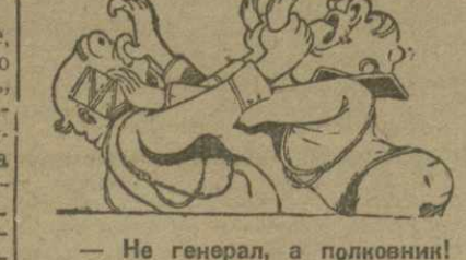
— Не генерал, а полковник! — Нет, не полковник, а генерал!

«Кантор Шпиро в зале мерида 10-го аррондисмана прочтет журнал «Самодеятельная православие и патриотство». Вход бесплатный. На покрытие расходов 3 франка с человека.