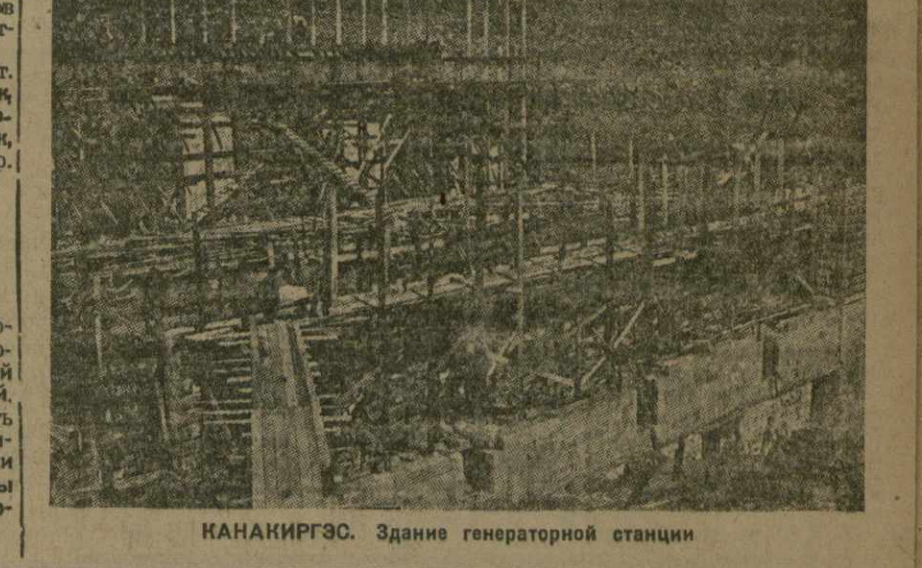
КАНАКИРГЭС. Здание генераторной станции