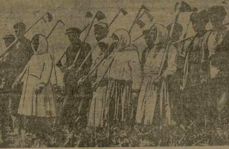
Колхозники колхоза «Красный уголок» (Гянджинский район) выходят в поле на обработку посевов хлопчатника.

Слабым местом в организации обработочной кампании является недостаточное использование женского труда.