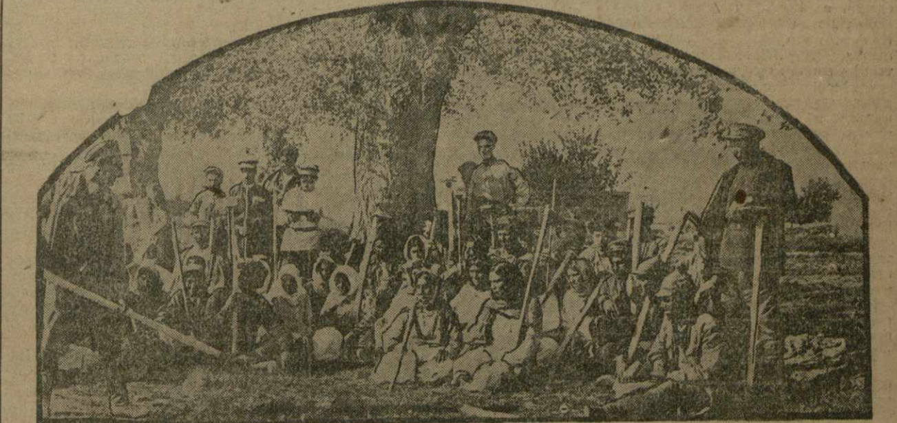
Первая бригада колхоза «Ени Маданит» слушает объяснение своего бригадира, как обращаться с кетменем при обработке посевов хлопка.

С 25 мая Армхлопок приступает к фактической проверке всходов хлопка, после чего будет организована выдача второй соуды под хлопок.