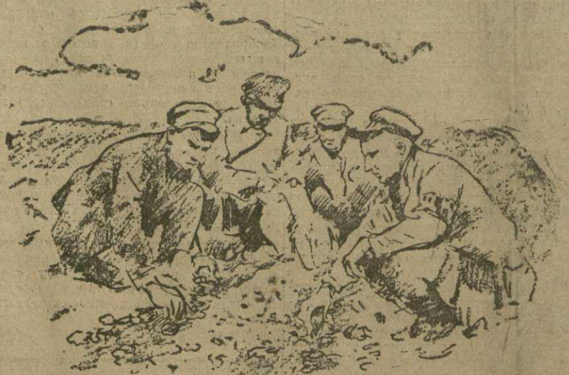
Проверка всходов хлопчатника в колхозе им. Сталина Джирбертского района