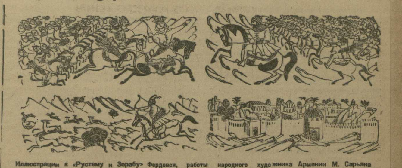
Иллюстрации к «Рустому и Зорбу» Фердовси, работы народного художника Армении М. Сарьяна