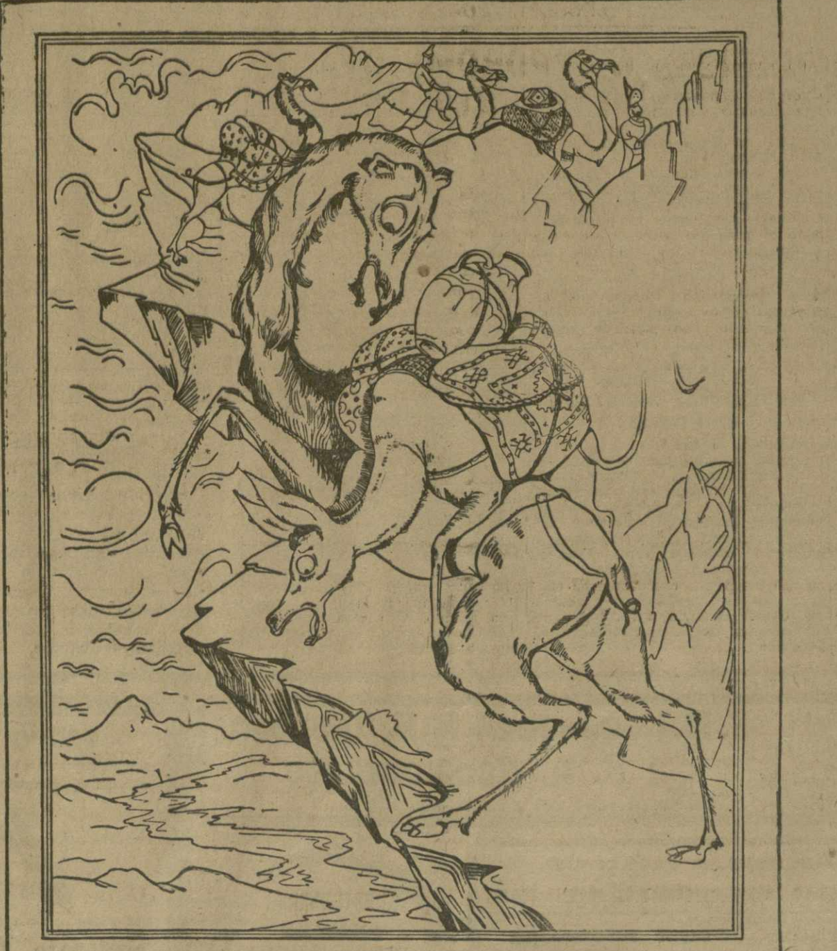
Иллюстрация Л. Гудиниши к рассказу «Глухой олень» из «Книги мудрости и лжи» Саба Сулхан Орбеллиани

Между тем, вопрос например, о языке в азербайджанской литературе не имеет узко-теоретического, но и глубоко принципиального значения. Надо сказать прямо, — М. Горький открыл нам глаза, в после его выступления — казавшиеся спорным стал бесспорным. Ведь не секрет, что некоторые наши писатели высказывались в том смысле, что дело не в языке: — пусть он будет слаб — язык политический все произведения. Однако, пора понять, что политический вес произведения не отделим от его качества, его языка, его доступности.