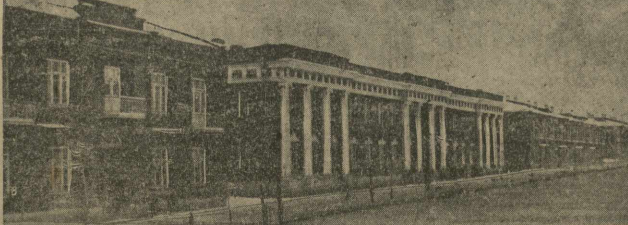
ЛЕНИНАКАН. Общий вид посёлка текстильного комбината.

Ленинакан был почти совершенно лишен растительности. Этой весной в городе посажено около 50 тыс. деревьев.