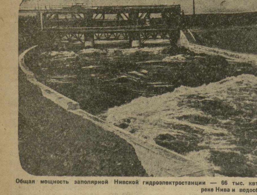
Общая мощность запорной Нивской гидроэлектростанции — 66 тыс. квт. НивГЭС — самая северная в мире гидроэлектростанция.

МОСКВА, 31. (ТА). 31 июля в Москве состоялся первый слет ударников строительства под'ездных путей к Москве.