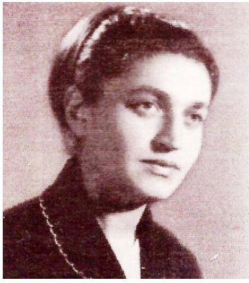
მზიური დათიაშვილი - ავტორი