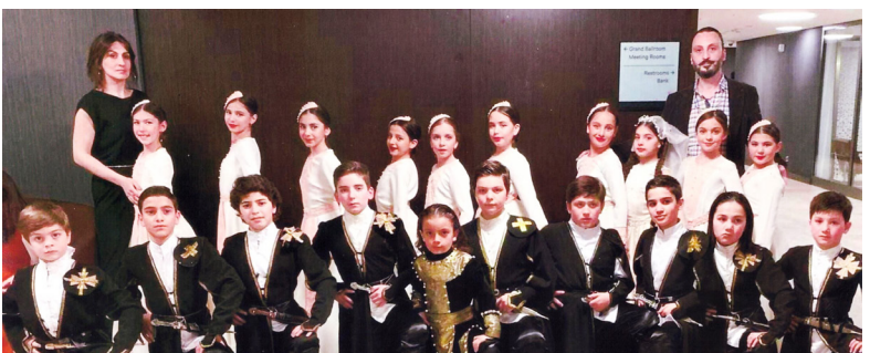
ანსამბლი „მიზრიბალა“ (ქორეოგრაფი: ნათია ჩიტაური, ბაქარ ხინთიბიძე)