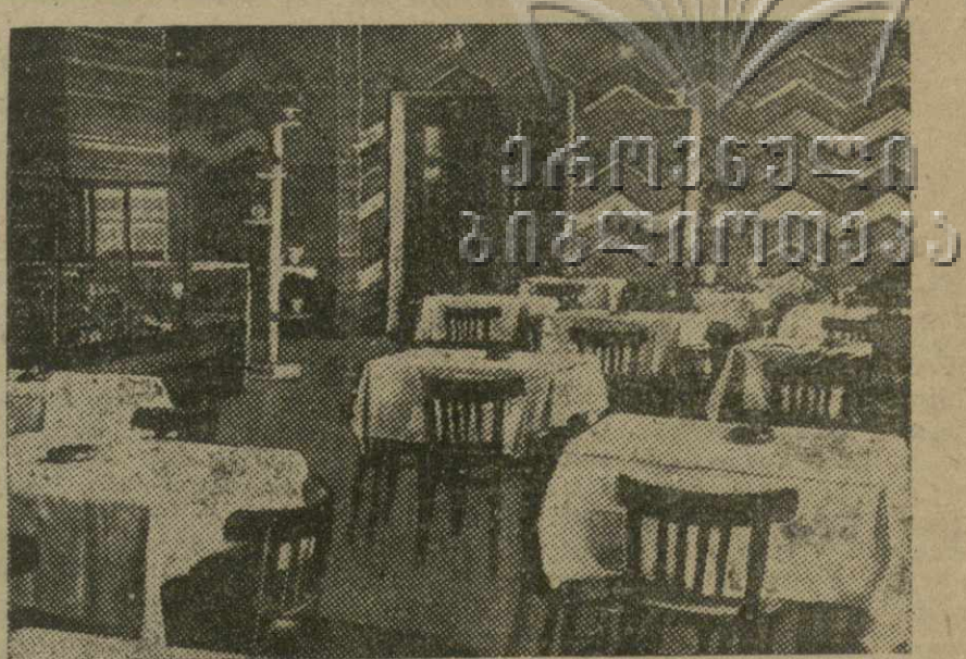
В Кировабаде идет строительство механизированного пищевого комбината. Первая очередь строительства — механизированная столовая — закончена и пущена в эксплуатацию. Пролуная способность столовой 7.000 блюд в день. На фото: новая столовая

5 апреля, в 6 часов вечера, в помещении редакции (комната № 8) состоится ОДИНАДЦАТОЕ ЗАНЯТИЕ СЕМИНАРА редакторов стеновых фабрично-заводских газет. «ЗАРЯ ВОСТОКА»