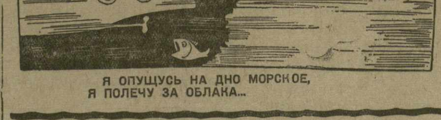
Рис. И. Гурро.