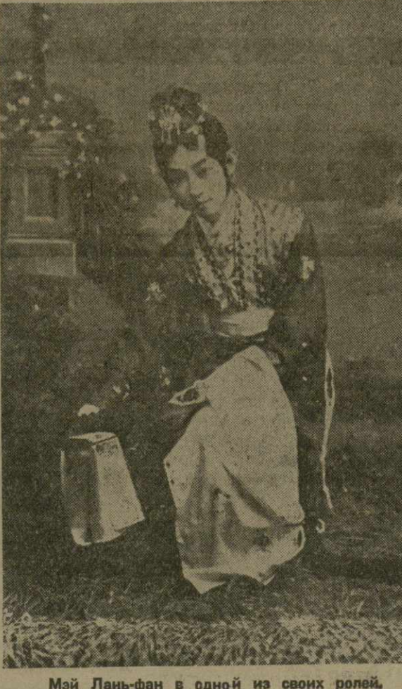
Май Лань-фан в одной из своих ролей.

— Я особенно рад своей поездке, — говорит Май Лань-фан, — потому что здесь, в СССР, могучий расцвет искусства. Наши гастроли — это знак величия культуры и культурной связи между нашими странами.