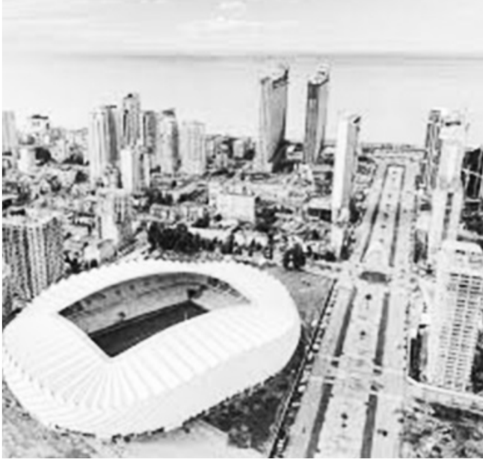
Дворец спорта. В 2022 году арена приняла игры чемпионата Европы по баскетболу.

Все встречи чемпионата мира по фехтованию примет новый