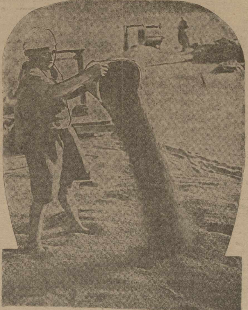
В Узбекистане между колхозами и совхозами развернуто соревнование на лучшую уборку урожая и обработку сажу государству лучшего хлеба нового урожая. На снимке: просушивание зерна нового урожая в зерносовхозе «Ударник» (Узбекистан).

В беседе с представителями печати и журналистами полковник Линдберг заявил, что пребывание в СССР было для него одним из самых интересных моментов его жизни, добавил, что увозит с собой наилучшие впечатления о Москве и надеется в недалеком будущем вернуться сюда.