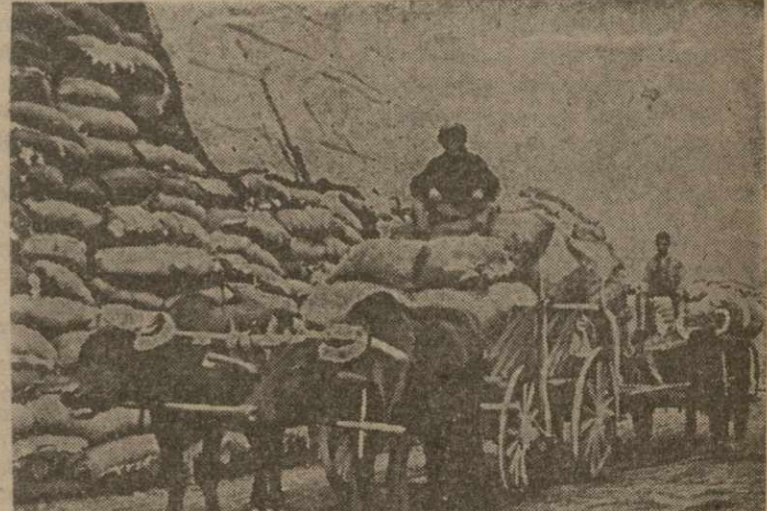
Колхозники из колхоза им. Сталина привезли на Ганджинский хлопкозавод собранный хлопок.