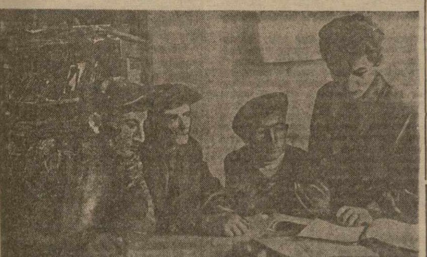
Первое занятие кружка на молодежном заводе им. Калинин

Недостатком партийной учебы являются также крупные недостатки в работе пропагандистов методработчиков и темой первой беседы. Об «оперативности» руководства пропагандистами и вообще всей организацией.