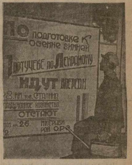
Плакаты о зимней партучебе на ок. Тифлис

БОГОРОДИЦ, 25. (ЗТА). 28 октября на шахте № 52, Товарновского района, открывается конференция по подземной газификации угля. На Крутовской шахте организуется второй опытный участок газификации по новым методам под руководством проф. Федорова.