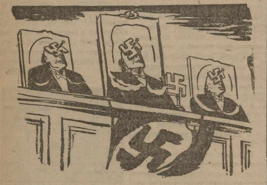
(Из эскиза «Арbeiter зоннтаг»)