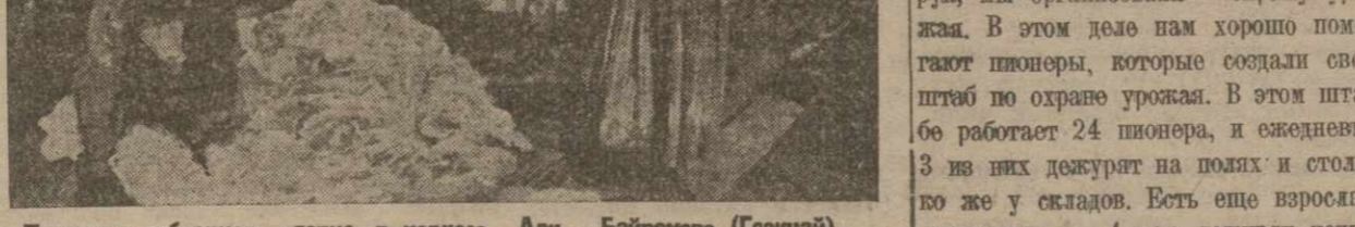
Просушка собранного хлопка в колхозе Али - Байрамова (Гонмай).

Урожай хлопка в нынешнем году очень хороший и по количеству и по качеству.