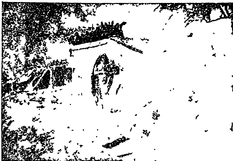
ტალახისა და თიხისაგან გაკეთებული ქოხი.

პენჯაბში, ბენგალიაში — ყველგან სწარმოებს იგივე ბრძოლა არსებობისათვის, ყველგან უმუშევრობაა, გლეხები ყველგან შიმშილობენ, ყველგან მცირე ხელფასია და დიდი სამუშაო დღეა სოფლის მოჯამაგირეებისათვის. ყველგან დიდი სასოფლო-სამეურნეო