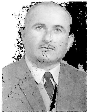
სოციალისტური შრომის გმირი მახვილ ლევდაშვილი