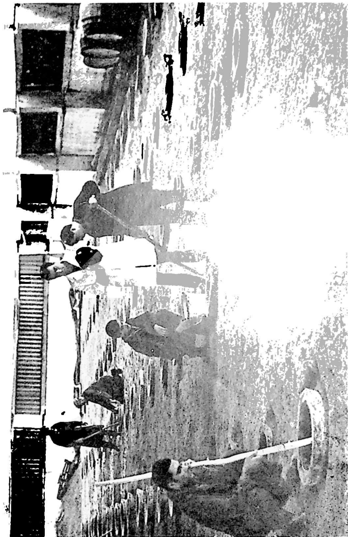
ლენინს კარხანაში (წითელი შუკრო)