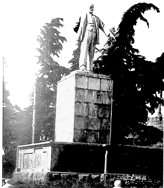
ლენინის ძეგლი ქ. სიღნაღში