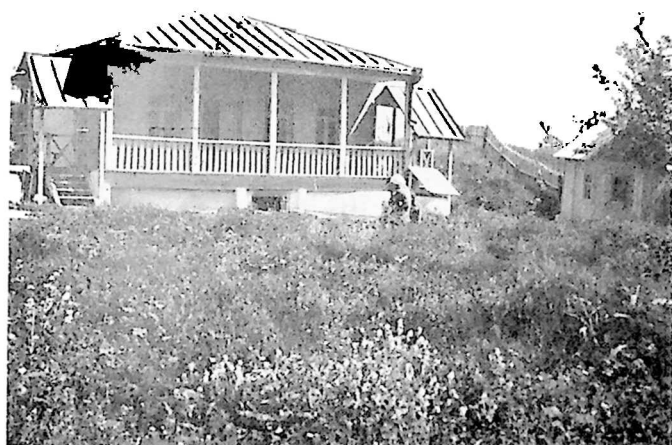
ნიკო ფიროსმანაშვილის სახლ-მუზეუმი სოფ. შირზაანში (წითელი წყაროს რაიონი)