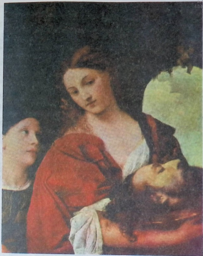
სალომე და იოანე ნათლისმცემლის თავი. მეთექვსმეტე საუკუნის იტალიელი ფერმწერის ტიცციანის ნახატი.