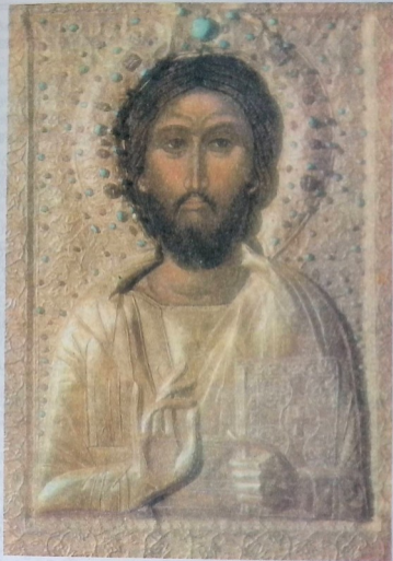
იესო ქრისტე. მეთექვსმეტე საუკუნის ქართული ფერწერული ხატი.