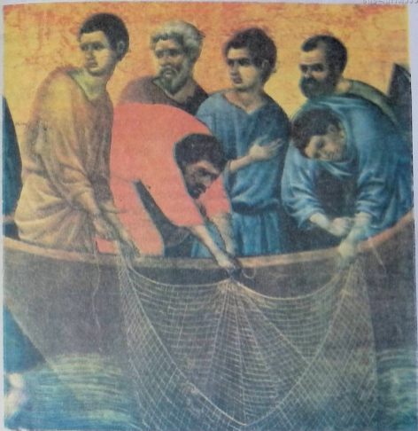
პეტრე და ანდრია მოციქულთა ხმობა. მეცამეტე-მეთოთხმეტე საუკუნეთა იტალიელი მხატვრის დუჩოს ნახატი.