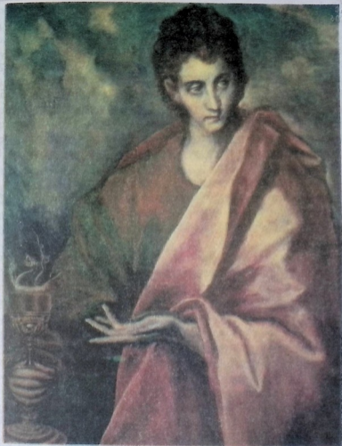
იოანე მოციქული. მეთექვსმეტე-მეჩვიდმეტე საუკუნეთა ესპანელი ფერმწერის ელ გრეკოს ნახატი.