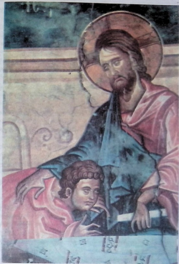
საიდუმლო სერობა, იესო ქრისტე და იოანე მოციქული. უბისის ტაძრის (IX ს.) მხატვრობა მეთოთხმეტე საუკუნისა.