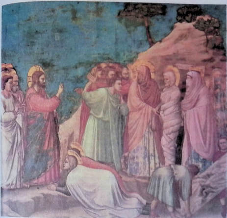
ლაზარეს აღდგინება. მეთოთხმეტე საუკუნის იტალიელი ფერმწერის ჯოტოს ნახატი.