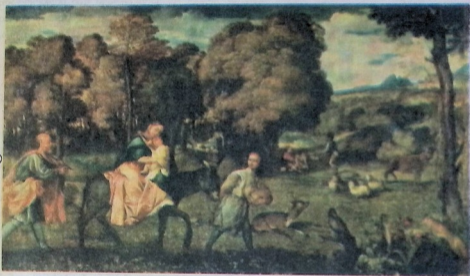
ეკვიპტელ ლტოლვა. მეთექვსმეტე საუკუნის იტალიელი ფერმწერის ტიცოანის ნახატი.