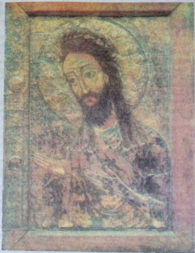
იოანე ნათლისმცემელი. მეცამეტე საუკუნის ჯეორჯიანული ხატვა.