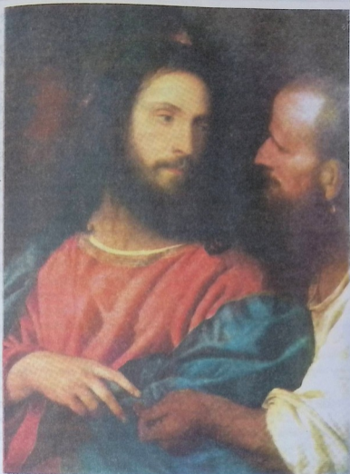
კეისრის ღინარი. მეთექვსმეტე საუკუნის იტალიელი ფერმწერის ტიციანის ნახატი.