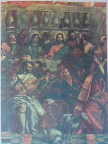
კანას ქორწილი. მეთექვსმეტე საუკუნის იტალიელი ფერმწერის პაოლო ვერონეზეს ნახატი.