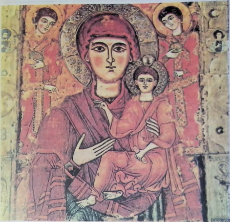
წილკანის ღვთისმშობლის ხატი. მეცხრე საუკუნის ხელობა.