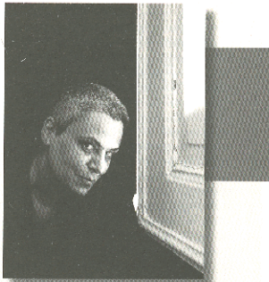
კარანტინი. 2020 წელი

მაგებობაში ასე ცვეკვაზე ვიყავი. ცვეკვაზე ცალკე დავდიდი, მაგრამ ცვეკვაზე ვცემოვდი. აი, სახლში, მავალითადა, მეტყობდნენ, მაცივრიდან რაღაც მოიტანე, ნადიდოდი ცვეკვა-ცვეკვით და მივიტანდი ცვეკვა-ცვეკვით. ოღონდ ხანდახან გსაში მავრყეფობდა კიდევ რისი მოქტანა დამავალეს, ისეთი გაროული ვიყავი ჩენი მოძრაობებით. სკოლიდან მოვიდოდი და ორი საათი ვიცვლიდი ტანსაცმელს ცვეკვა-ცვეკვით, ოღონდ მართლა ორი საათი და შერე, სადაღაც საღამოაქვენ, ძლივს დავუვადებოდი სამცეადინოდ, ძალიან მადლიერი ვარ იმის, რომ სახლში ამის არავინ მოხლდა. არ მასხავს, ეს ცვეკვა როდის შეეწყვიტე, ალბათ მამის, როცა უფრო თინეჯერიობიდან ნადედი. ახლა ცვეკვა ხშირად არც მახსოვს, რომ არსებობს. არც თავიდან დაეინყებდი ცხოვრებას, არც სხვა ადამიანად დავიბადებოდი, მგონია, რომ ერთხელ ცხოვრებაც საქმარისი გამოცდილებაა, მაგრამ რომ მიითხრან, ერთი წელიწადი წარსული დაგაბრუნებ, იცი, რომელ ერთ წელს ავირჩევ? აი, ათი წლის რომ ვარ. ვცეკვავ და ყველაზე მსუბუქი ადამიანი ვარ დედამინაზე.