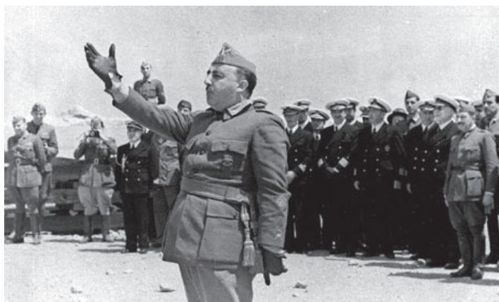
გენერალი ფრანკო სამხედრო-საზღვაო ძალების წინაშე სიტყვით გამოდის. 1938წ.