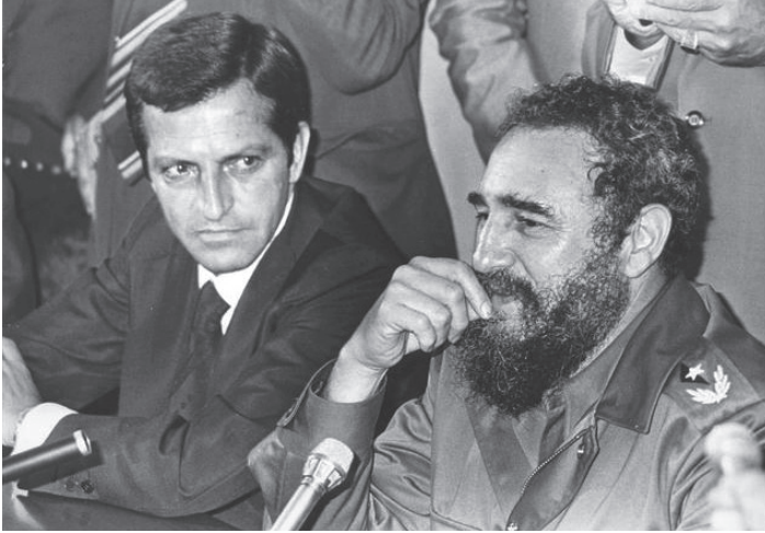
ადოლფო სუარესი და ფიდელ კასტრო.