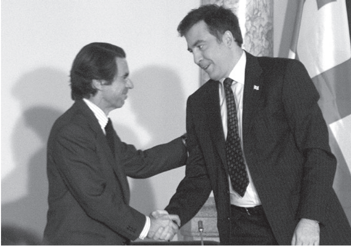
ესპანეთის ყოფილი პრემიერ-მინისტრი ხოსე მარია ასნარი და საქართველოს პრეზიდენტი მიხეილ სააკაშვილი.