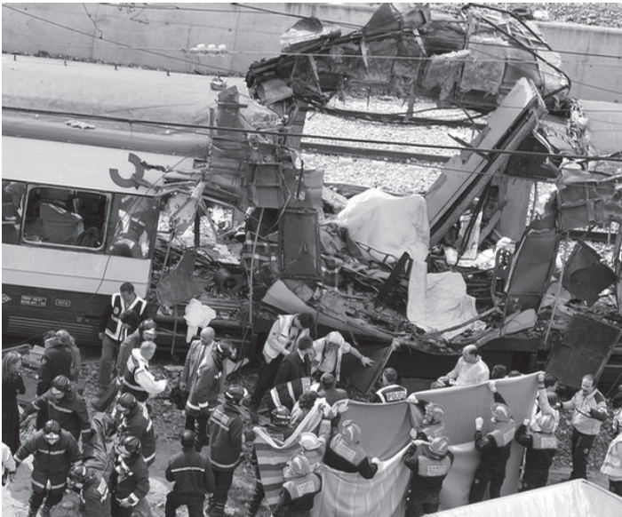
2004 წლის 11 მარტს ალ ყაიდას მიერ განხორციელებული ერთ-ერთი ტერაქტი მადრიდში. ტერაქტების შემდეგ საპატერომ მიიღო გადაწყვეტილება ერაყიდან ესპანეთის შვიარაღებული ძალების გამოყვანის შესახებ.