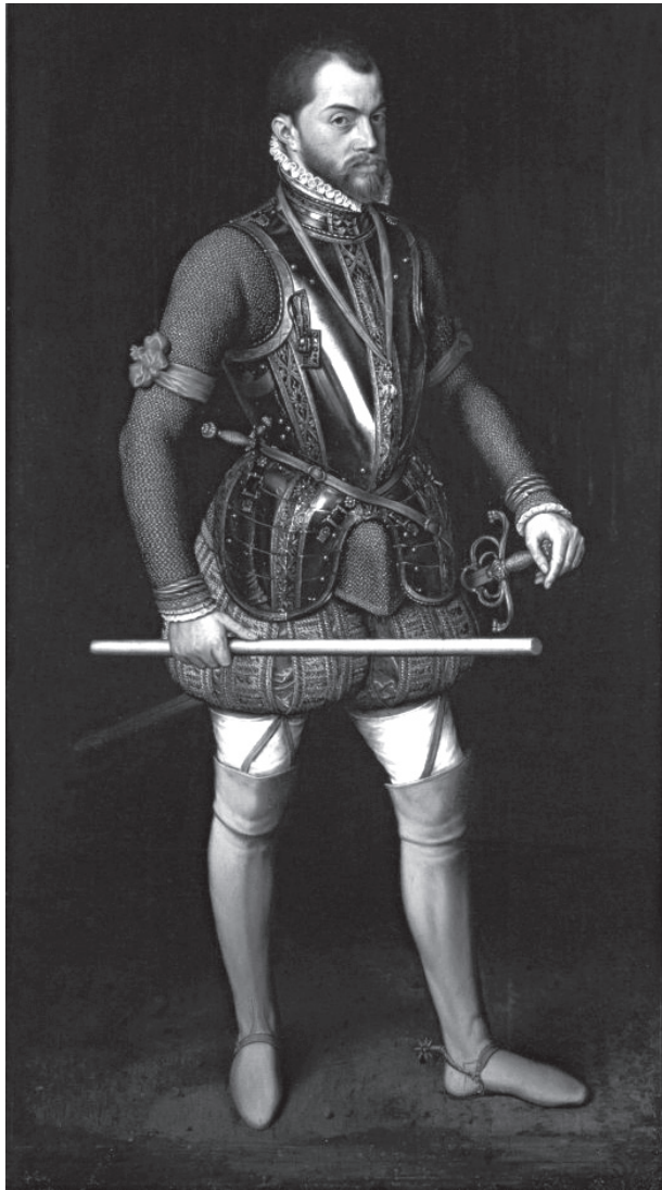
ფილიპე მეორე (1527-1598)