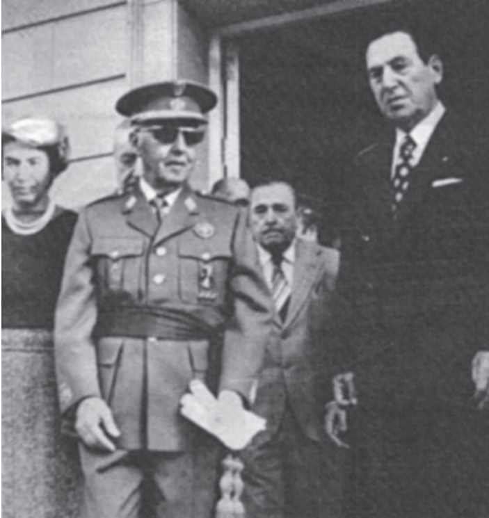
ფრანკო და პერონი.