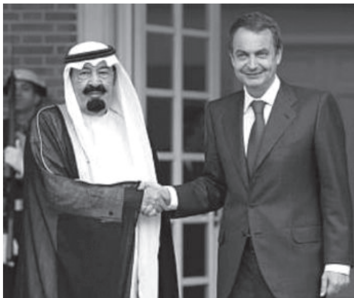
საპატერო და საუდის არაბეთის მეფე აბდულა.