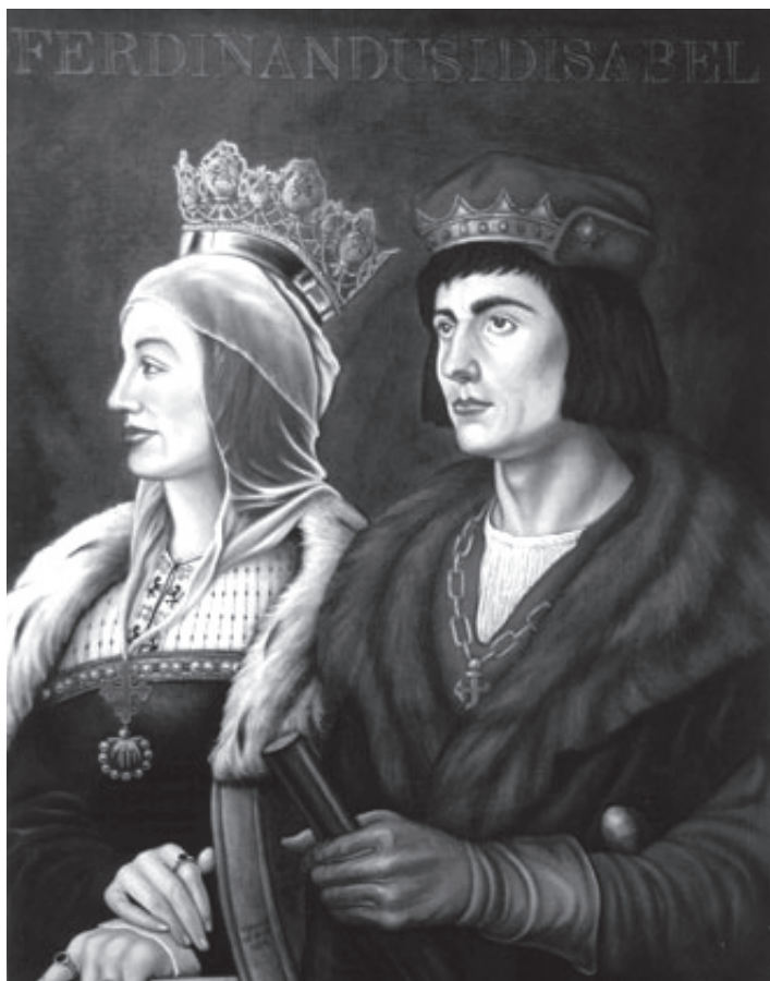
ესპანეთის „კათოლიკე მეფეები“ იზაბელა კასტილიელი და ფერნანდო არაგონელი.