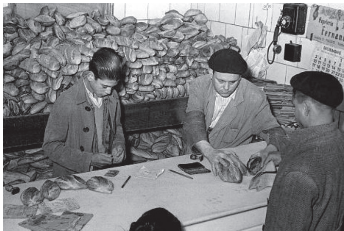
ფრანკოს დიქტატორული რეჟიმის დამყარების შემდეგ ესპანეთში შიმშილი მძვინვარებდა, პური ტალონებით იყიდებოდა.