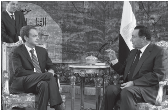
საპატრო და ჰოსნი მუბარაკი.