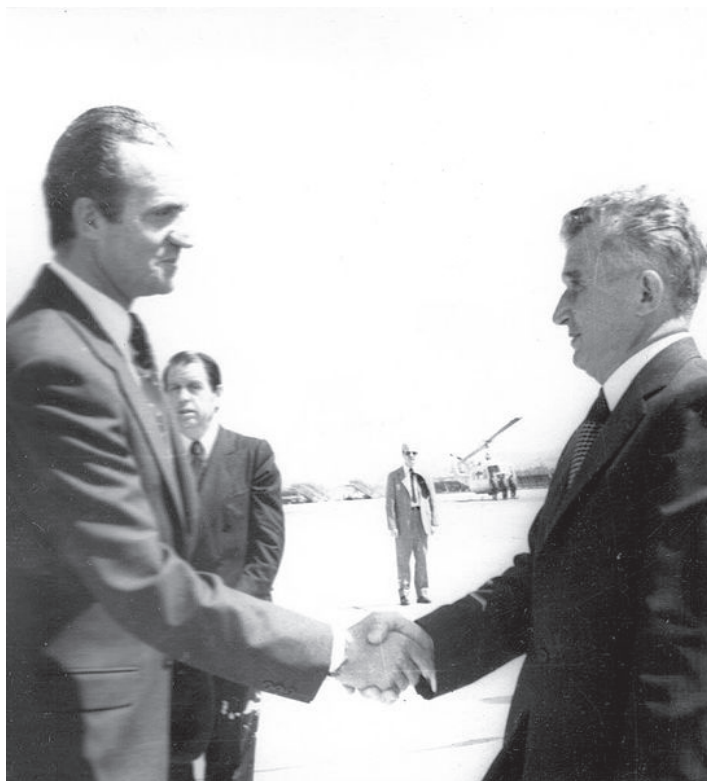
ესპანეთის მეფე ხუან კარლოსი და რუმინეთის ლიდერი ნიკოლას ჩაუშესკუ.