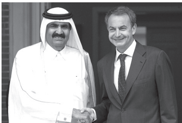
საპატერო და ყატარის ემირი.