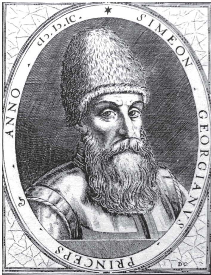
ქართლის მეფე სიმონ I (1537-1603).