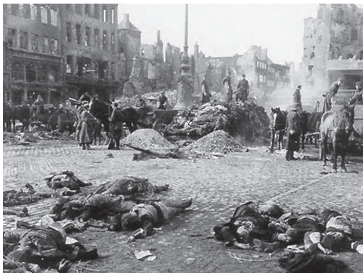
ფრანკომ სამოქალაქო ომის დროს, 1937 წლის 26 აპრილს, ბასკური ქალაქი გერნიკა მიწასთან გაასწორა.