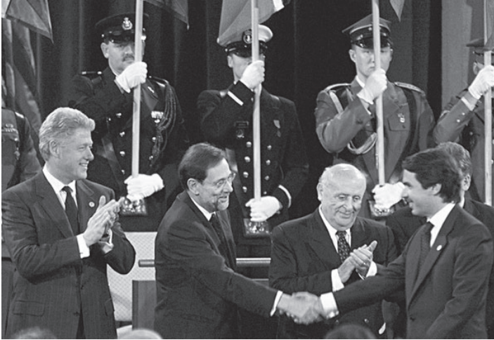
ამერიკის პრეზიდენტი ბილ კლინტონი, ნატოს გენერალური მდივანი ხა- ვიერ სოლანა, თურქეთის პრეზიდენტი სულეიმან დემირელი და ესპანეთის პრემიერ მინისტრი ხოსე მარია ასნარი ნატოს სამიტზე. 1999 წელი.