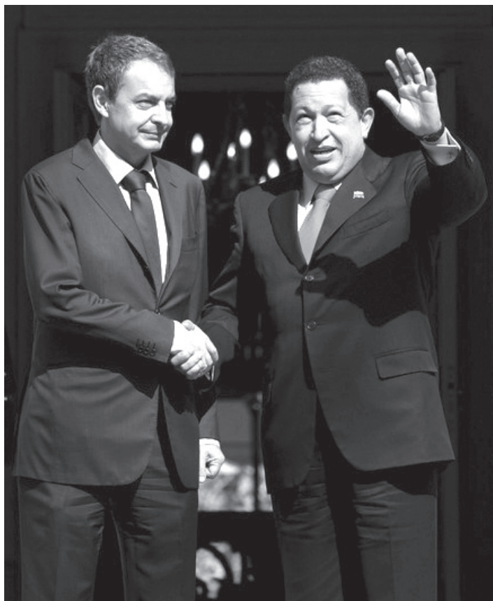
ესპანეთის პრემიერ მინისტრი ხოსე ლუის როდრიგეს საპატერო და ვენესუელას პრეზიდენტი უგო ჩავესი. მადრიდი, 2009 წლის 11 სექტემბერი.