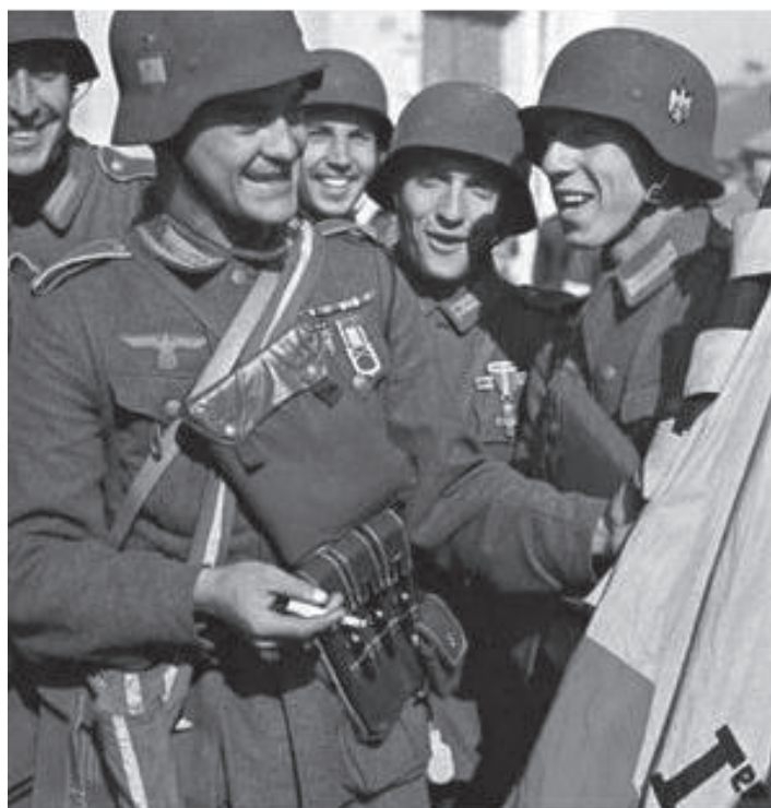
ესპანური „ცისფერი ლეიზია“.