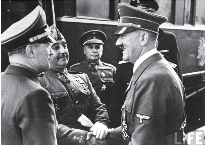
ფრანკო და ჰიტლერი. ორმა დიქტატორმა საერთო ენის გამონახვა ვერ შესძლო.