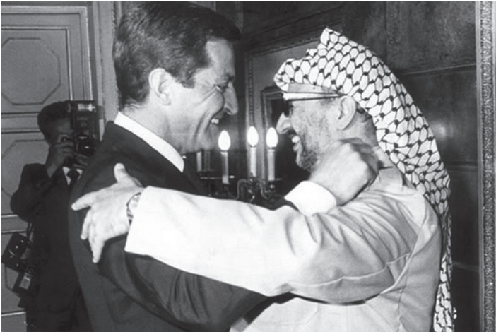
ადოლფო სუარესი და ისირ არაფატი.