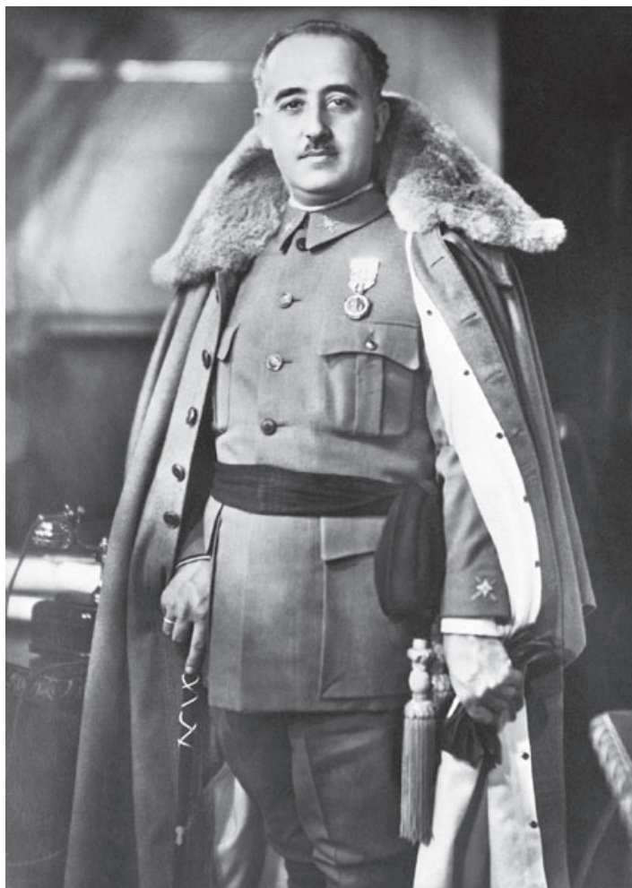
Franco - Caudillo de España. ფრანკო – ესპანეთის „კაუდილო“ („მეთაური“).