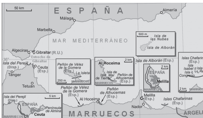
ესპანეთის შემადგენლობაში დარჩენილი ტერიტორიები აფრიკაში.