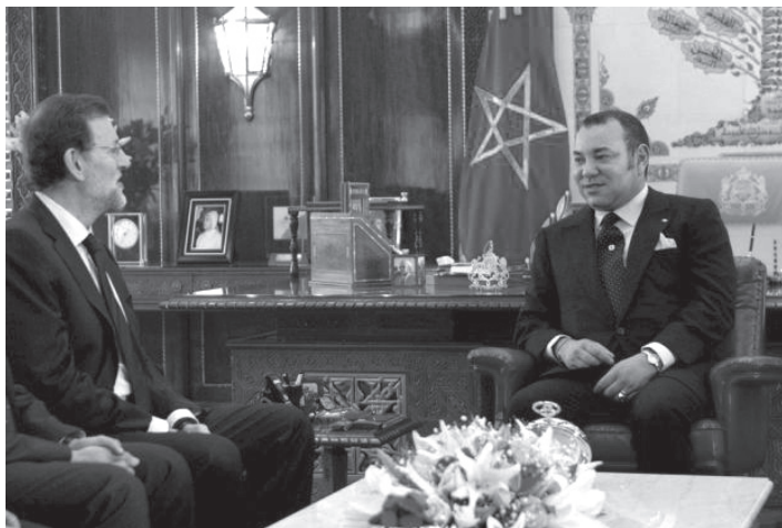
ესპანეთის პრემიერ მინისტრი მარიანო რახოი და მაროკოს მეფე მუჰამედ მეექვსე.