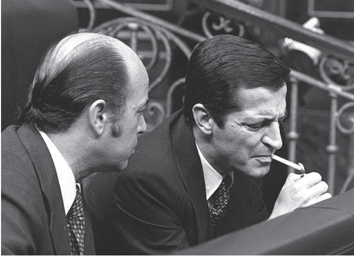
ადოლფო სუარესი ესპანეთის პარლამენტში სიგარეტს ეწევა.