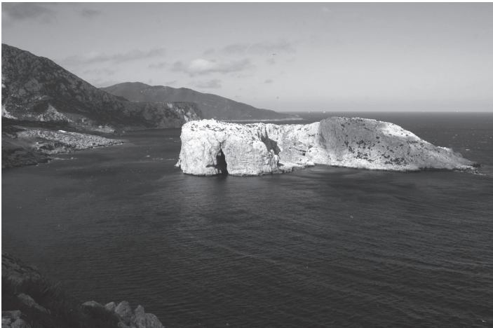
კუნძული პერეხილი ერთ პატარა კდლეს წარმოადგენს, რომელიც არის სადაო ტერიტორია ესპანეთსა და მაროკოს შორის.