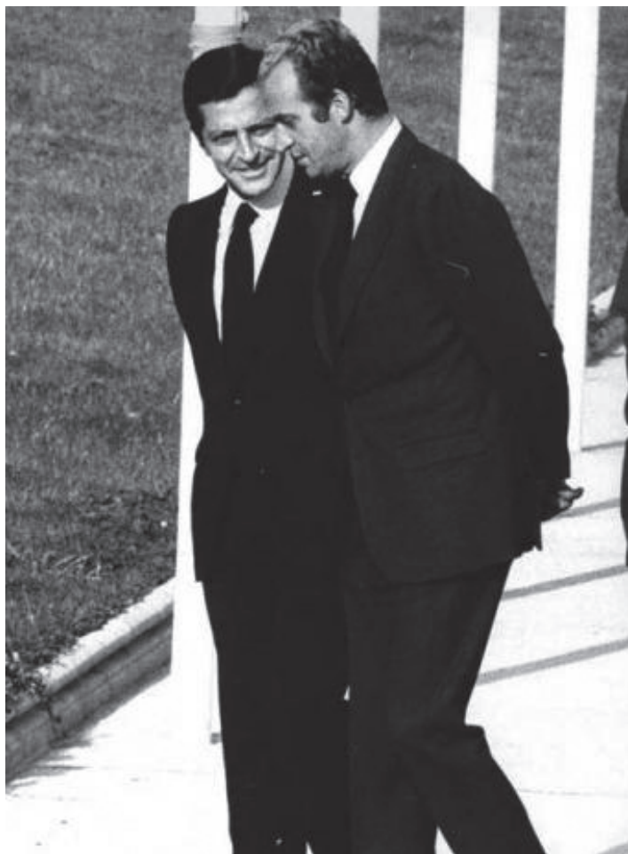
ადოლფო სუარესი და ხუან კარლოსი.