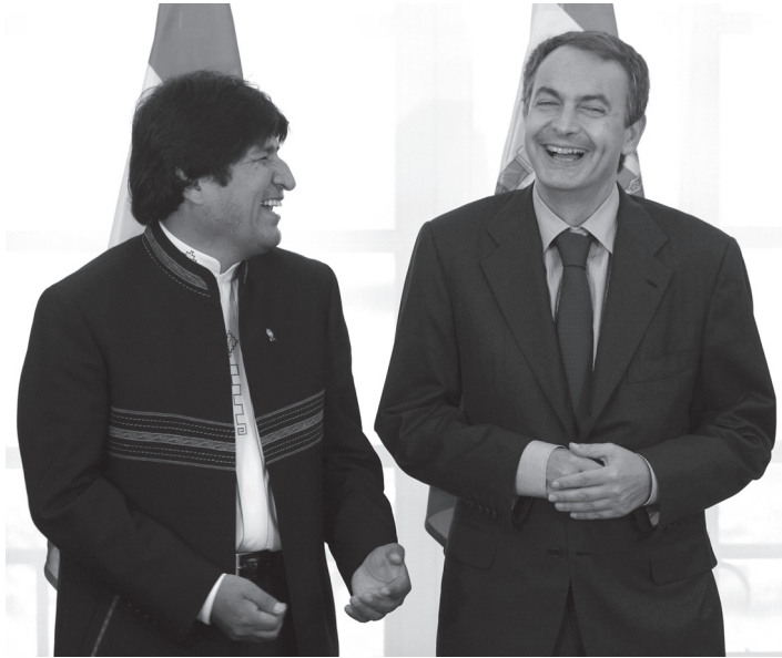
ესპანეთის პრემიერ მინისტრი ხოსე ლუის როდრიგეს საპატერო და ბოლივიის პრეზიდენტი ევო მორალესი. მადრიდი, 2009 წლის 15 სექტემბერი.