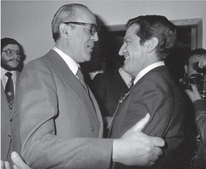
ადოლფო სუარესი და ლეოპოლდო კალვო სოტელი.