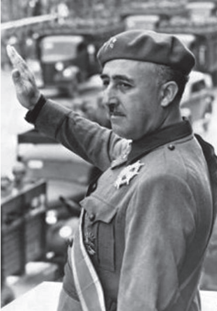
ფრანკო ესპანეთის სამოქალაქო ომში გამარჯვებას ზეიმობს.