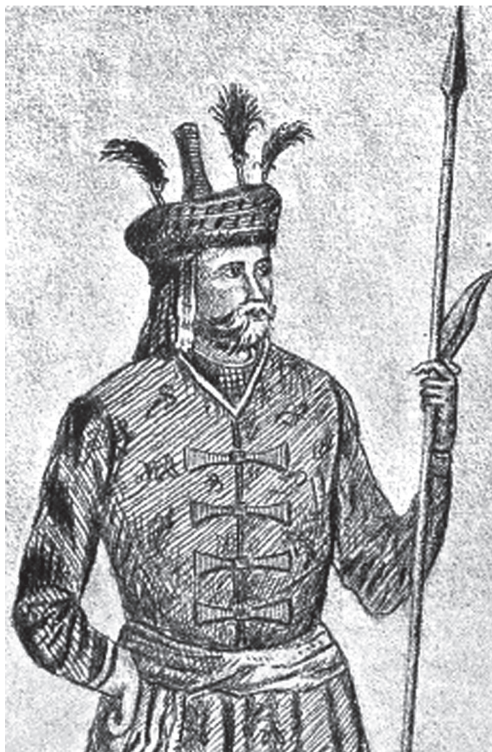
კახეთის მეფე ალექსანდე მეორე (1527-1605).