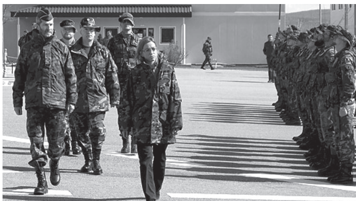
ესპანეთის თავდაცვის მინისტრი კარმე ჩაკონი ლეზულობს გადაწყვეტილებას კოსოვოდან ჯარების გამოყვანის შესახებ.