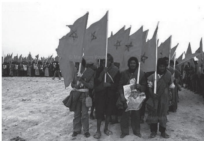
მწვანე მარში, 1975 წელი. ესპანეთმა უბრძოლველად დაუთმო დასავლეთ საჰარა მაროკოს.