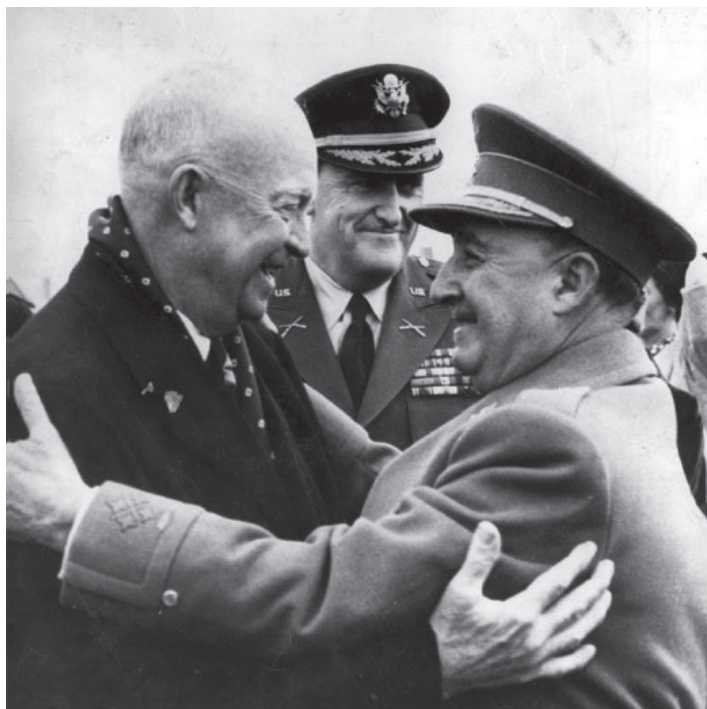
ფრანკო და აშშ-ის პრეზიდენტი აიზენჰაუერი.

ესპანეთმა საერთაშორისო იზოლაციისაგან თავის დაღწევა შესძლო არა ფრანკოს გენიოსობის წყალობით, არამედ ცივი ომით გამოწვეული დაპირისპირების შედეგად. 2 მას შემდეგ რაც ურთიერთობა კომუნისტურ და კაპიტალისტურ ბანაკებს შორის უკიდურესად დაიძაბა, ამერიკის შეერთებული შტატებისათვის ფრანკოს ანტიკომუნისტური განწყობა და ანტიბოლშევიკური რიტორიკა სულ უფრო და უფრო მისაღები გახდა. ჩინეთის სახალხო რესპუბლიკის შექმნამ, კო-