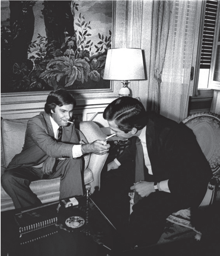
ფილიპე გონსალესი და ადოლფო სუარესი.

ხშირად აკრიტიკებდა საპატეროს ლათინური ამერიკის მემარცხენე ლიდერებთან დაახლოების გამო და ამერიკის შეერთებულ შტატებთან ურთიერთობების დაძაბვის გამო.