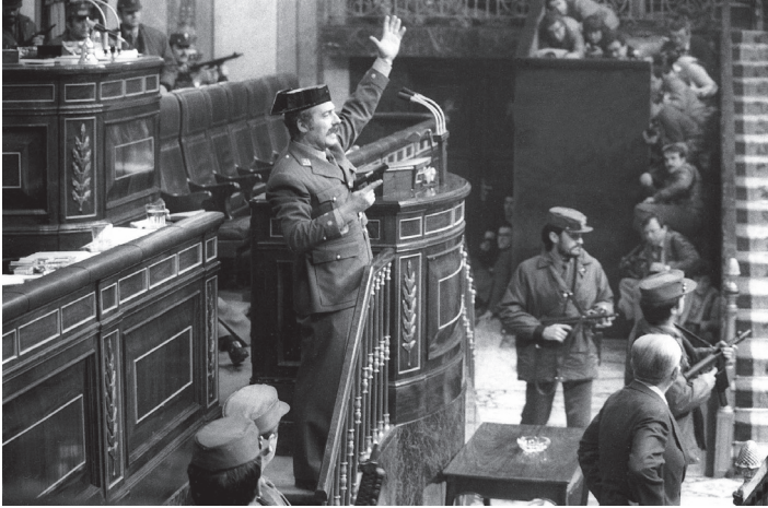
სამხედრო გადატრიალების მცდელობა. სამხედრო ძალები ანტონიო ტეხერო მოლინას ხელმძღვანელობით ესპანეთის პარლამენტში შეიჭრნენ. 1981წ.