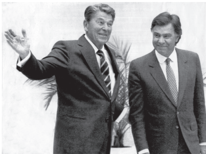
აშშ-ის პრეზიდენტი რონალდ რეიგანი და ესპანეთის პრემიერ მინისტრი ფილიპე გონსალესი.