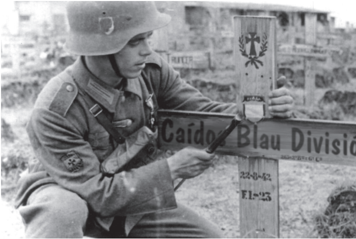
აღმოსავლეთის ფრონტზე 4954 „ცისფერი დივიზიის“ ჯარისკაცი დაიღუპა, 8700 დაიჭრა, ხოლო 372 ტყვედ ჩავარდა.

მეორე მსოფლიო ომის შემდეგ ესპანეთი გარეყული აღმოჩნდა არა მხოლოდ ევროპაში მიმდინარე პროცესებისაგან, არამედ მთელი დასავლეთის ცივილიზებული სამყაროსაგან. სასონარკვეთილი ფრანკო ცდილობდა რომ მისი რეჟიმისათვის ლეგიტიმურობა გაეზარდა, დაშორებოდა ფაშისტურ წარსულს და აქცენტი კათოლიციზმზე და კათოლიკური რელიგიის სიყვარულზე გაეკეთებინა. მან გადაწყვიტა, რომ მისი რეჟიმისთვის დამახასიათებელი ფაშისტური ელემენტები შეერბილებინა და თავისი ხელისუფლება წარმოეჩინა როგორც ანტიკომუნისტური ბასტიონი ევროპაში. 44 ესპანეთში ეკონომიკური სიტუაცია კრიტიკული იყო და ფრანკოს მომავალიც გაურკვეველი ჩანდა. მოგვიანებით ესპანეთის სოციალისტური მთავრობის საგარეო საქმეთა მინისტრი,