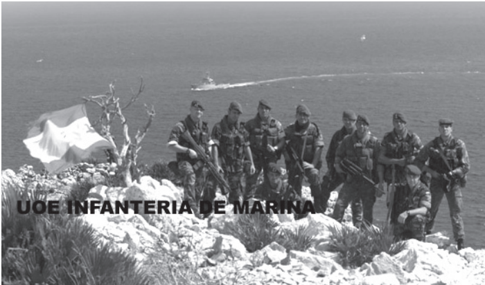
ესპანეთის შვიარაღებული ძალები კუნძულ პერეხილს აკონტროლებენ.