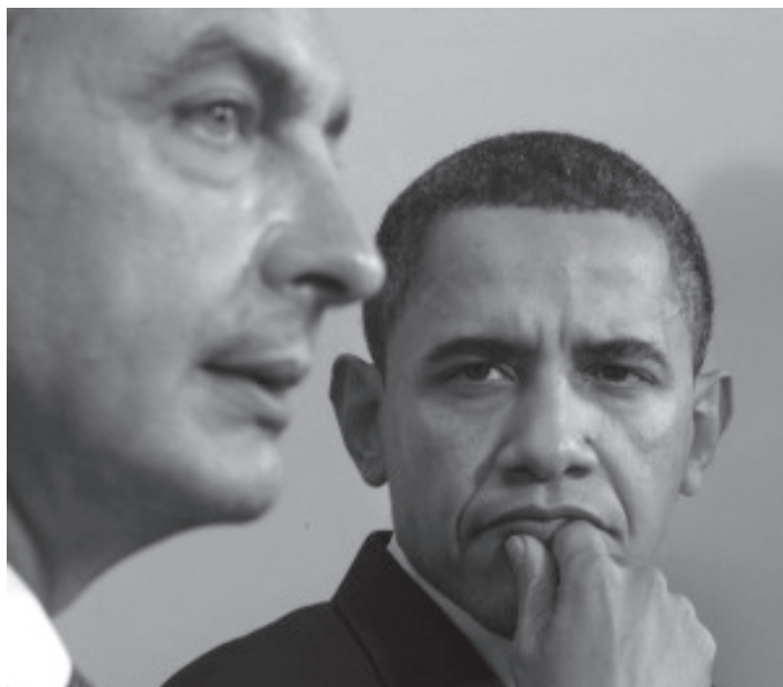
ესპანეთის პრემიერ მინისტრი ხოსე ლუის როდრიგეს საპატერო და აშშ-ის პრეზიდენტი ბარაკ ობამა.