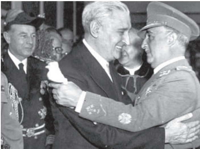
ფრანკო და სალazarი.

იმ პერიოდში ფრანკოს რეჟიმის უმთავრესი მიზანი ესპანეთის იზოლაციის დასრულება იყო და მისი ინტეგრაცია როგორც ევრო-ატლანტიკურ სტრუქტურებში, ასევე მსოფლიო თანამეგობრობაში. ვითარება თანდათანობით ფრანკოს სასარგებლოდ იცვლებოდა.