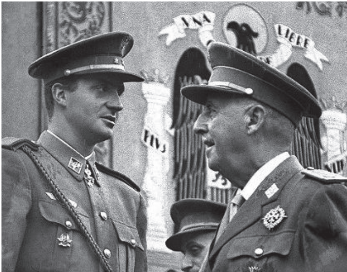
ფრანკომ მემკვიდრედ ხუან კარლოსი აირჩია.

ნატოს წევრობა იყო სასონარკვეთელი ხელისუფლების მცდელობა, რომ თავის კონტროლს დაექვემდებარებია სამხედროები, მოეხდინა ზენოლა პოლიტიკურ ოპონენტებზე და განემუხტა დაძაბული პოლიტიკური სიტუაცია. 7