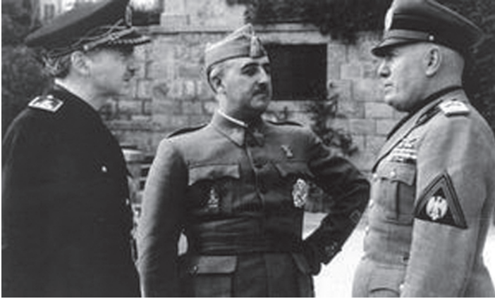
ფრანკო, ესპანეთის საგარეო საქმეთა მინისტრი რამონ სერანო სუნიერი და მუსოლინი.