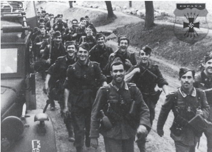
ფრანკომ აღმოსავლეთის ფრონტზე ესპანური „ცისფერი დივიზია“ გაგზავნა საბჭოთა კავშირის წინააღმდეგ საბრძოლველად.