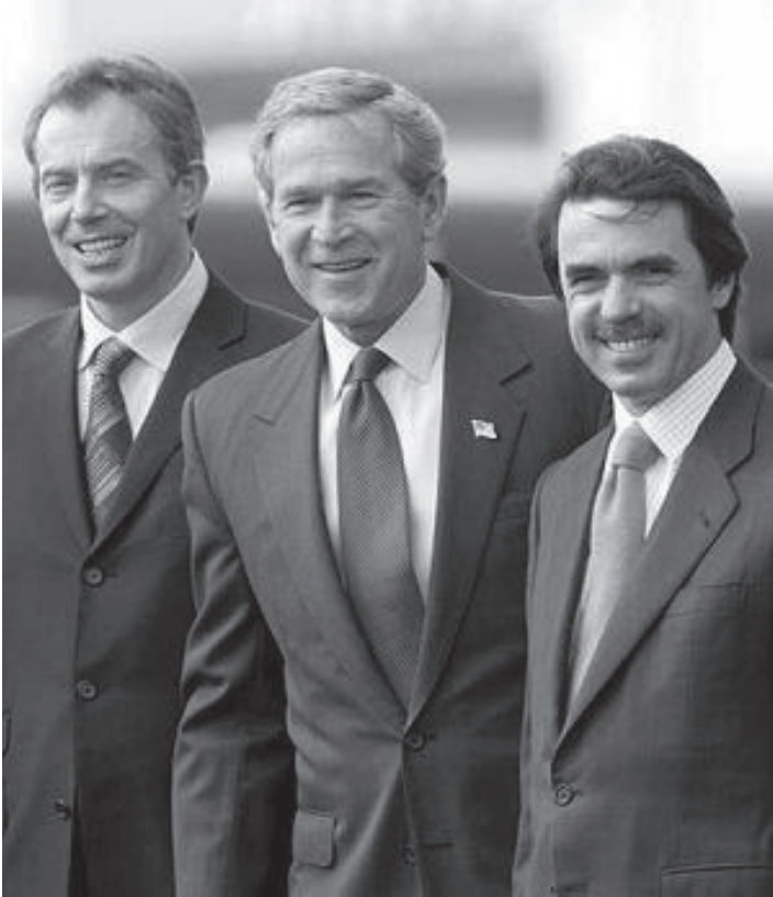
ტონი ბლერი, ჯორჯ ბუში და ხოსე მარია ასნარი.