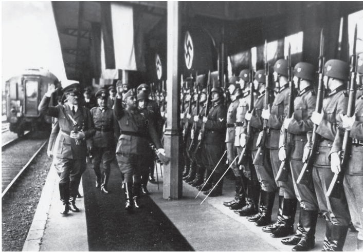
ფრანკოს შეხვედრა ჰიტლერთან, ესპანეთ-საფრანგეთის საზღვართან. 1940 წლის 23 ოქტომბერი.