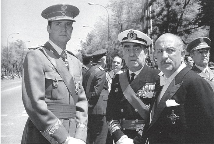
ესპანეთის მეფე ხუან კარლოსი და ლუის კარერო ბლანკო.