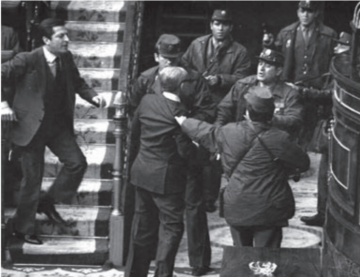
სამხედრო გადატრიალების მცდელობა. მარცხენა მხარეს დგას ესპანეთის პრემიერ მინისტრი ადოლფო სუარესი. 1981წ.