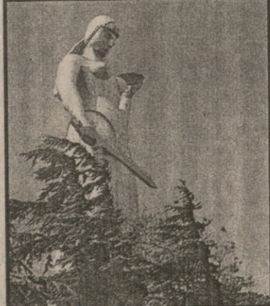
თველო, გარდა ხოლვის მუშაობისა, მისივე ხელსაწყოებისა, მისივე დატვირთულია...