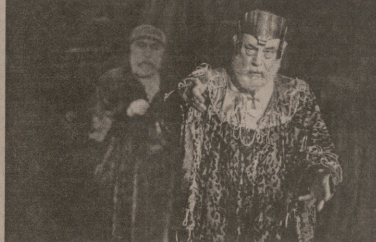
როგორ უნდა გააკეთო, არ არსებობს. სცენაზე რომ აზარტი აუცილებელია, ამაზე უკვე დაფიქსირებულია...