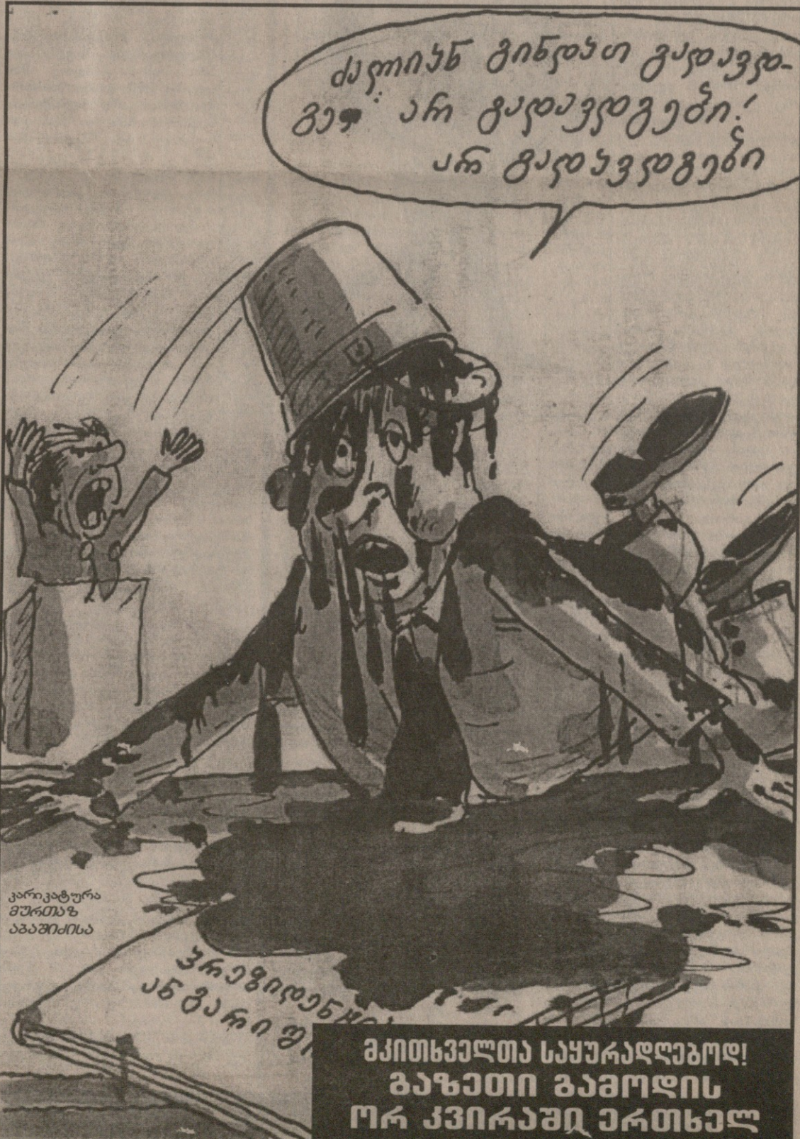
კარიკატურა მურთაზ აბაშიძისა

„ვიცი ადამიანები, რომელთაც აკადემიის ინსტიტუტში მუშაობისას კომუნისტების დროს ყური სულ სხვის კარებზე ჰქონდათ მიდებული, რათა მარტივი „ინფორმაციის“ ფუნქცია შეესრულებინათ, ვისთანაც „ჯერ-არს“. დღეს ისინი იდეოლოგიურ-პოლიტიკურ დაწესებულებებს ხელმძღვანელობენ და ჩვენი ქვეყნის კვალობაზე მაღალ ხელფასებს იღებენ დოლარებში. რას ნიშნავს ეს? დასავლეთი ბრმაა? არა, ეს უბრალო ეკონომიაა. თუ ბოსტანში პამიდორი გინდათ, უფრო ადვილია, ჩითილი იყიდოთ, ვიდრე მცენარე თესლიდან გააღვივოთ. ასევე, უფრო ადვილია ერთხელ უკვე დაგრეხილ-გადაგრეხილი, განურული და ნებანართმეული კაცის ჩაყენება თქვენს სამსახურში, ვიდრე მისი, ასე ვთქვათ, თავიდან დამუშავება. მაგრამ ასეთი პრაქტიკა მხოლოდ შემდეგს მოწმობს.“