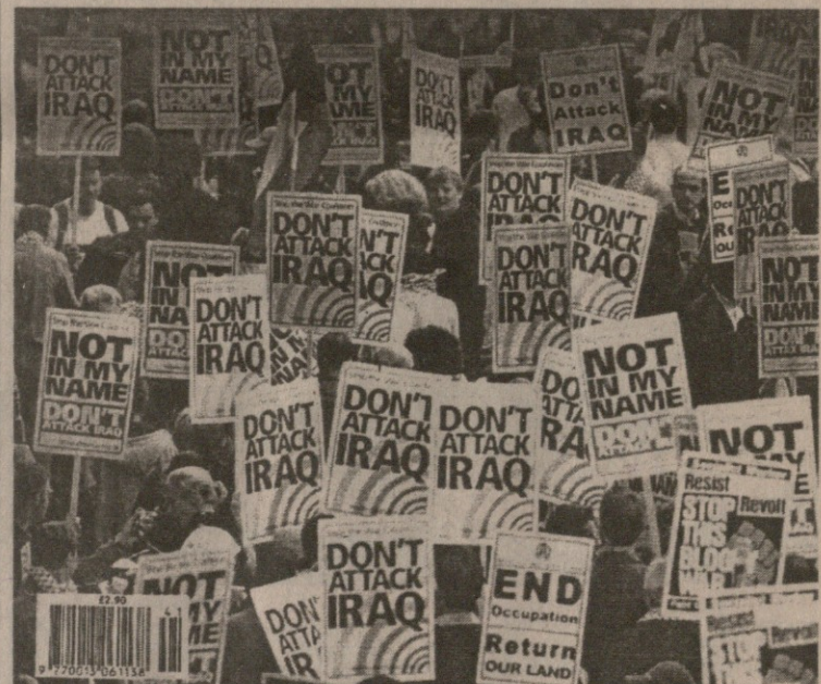
მანიფესტაცია ომის არდაწყების მოთხოვნით. მრავალ პლაკატს აწერია: „არა ჩემი სახელით“ („ECONOMIST“-ის ყდა)

იომინა „გაცურება“ პუსეინის მიერ — „იარაღი აღარ მაქვს“ — სწორედ ამით შეიქმნა ის სიფათი, რომელიც დღეს გვაქვს. თუ გაეროს ეცოდინება, რომ რეალურია უარის მთხვევაში ერთმხრივი დარტყმა ამერიკის მიერ, მაშინ მას მეტი სიმშვილე ექნება, საჭირო რეზოლუცია მიიღოს, ანუ მასში ამერიკელთა ან სხვათა მიერ იარაღის გამოყენების შესაძლებლობა შეიტანოს ბუშის დღევანდელი პოზიცია სწორედ ეს არის. იგი ამბობს, ომი გადუფალი არ არისო, მაგრამ მხოლოდ იმ შემთხვევაში, თუ გაეროს მექანიზმმა ვერ იმუშავა. მეორე განა შეიძლება დღეს ომი სხვაგვარად დაიწყოს თუ არა ან გაეროს დასტურით ან „პირდაპირი საშიშროების“ გამო? ყურნალის პასუხა: ის, რომ ერაყელი დიქტატორი მასობრივ მკვლელობის იარაღებს აგროვებს და თან მათი მიტანის საშუალებებსაც იმარაგებს (რაკეტებს), სწორედ უშუალო საფრთხეა ის, რომ ამ საფრთხეს ვერ ღია სახე არ მიუღია, საქმეს არ ცვლის. რაც შეეხება პალესტინის საკითხს, მათ შესახებ გაეროს რეზოლუცია კატეგორიული არ არის. იგი ამბობს, რომ ყოველივე უნდა მოგვარდეს უომრად, მაგრამ არ ამბობს,