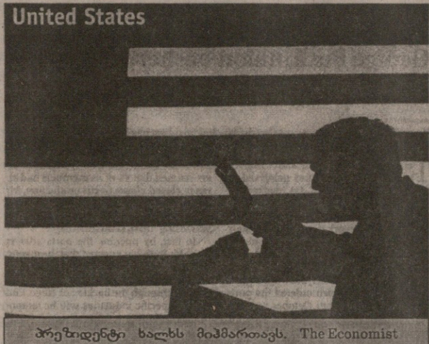
პრეზიდენტი ხალხს მიჰპარტავს. The Economist

ბუშის ენერჯიული სატელევიზიო გამოსვლა 7 ოქტომბერს იმას მოწმობდა, რომ იგი აპირებს რამდენიმე კვირამდე შეამციროს ის დრო, რომელიც საზოგადოებრივი აზრის შექმნას სჭირდება. ამჯერად მან, THE ECONOMIST-ის სიტყვით, ზომიერი და თავდაჭერილი ტონით ილაპარაკა. „იყო რამდენიმე ბრბოს მამაბებელი შტრიხი“, მაგრამ ძირითადად ეს სიტყვა იყო „ფრთხილი არჩევანის“ დემონსტრაცია. მის კოლოში, ჰამლეტის მამის მსგავსად, „მწუხარება უფრო იყო, ვიდრე რისხვა“. იგი ლაპარაკობდა უფრო როგორც იურისტი, ვიდრე როგორც მთავარსარდალი. იგი შეეცადა პასუხი გაეცა იმ კითხვებზე, რომლებიც ამერიკელებს დღეს ყველაზე მეტად აღელვებს: რატომ ერაყი და არა სხვა რომელიმე მიუღებელი რეჟიმი? იმიტომ, რომ იქ „კაცისმკვლეელი ტორანისა“ და მასობრივი