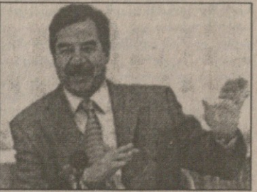
სადამ პუსეინი. გვ. 12, ECONOMIST, 5.X.

ერაყში გაეროს ინსპექტორთა დაბრუნებას იმავე მანდატით, რაც აქამდე რეზოლუციებშია გათვალისწინებული, აზრი არა აქვს. რატომ? იმიტომ, რომ პუსეინი ყველა პირობის გამტეხი და მატყუარაა. ეს მან უკვე მრავალჯერ დაამტკიცა. ასეთია ამერიკელების ამოსავალი დებულება. რა არის გამო-