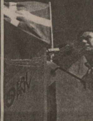
იბარეთემ და მისი დროშა.

წელს ეს დაზავება შეწყდა, რადგანაც დარეგულირების საქმე წინ ვერ წავიდა. ამჯერად ეს პარტია უარყოფს ყოველგვარ კონტაქტს „ეტასთან“ და მისმა პოლიტიკურმა ფრთამ, „ბატასუნამ“ დაგმო იბარეთეს გეგმა. შერეგების იმედი არის, მიუხედავად იმისა, რომ „ბატასუნა“ გაუქმებულია სასამართლოს მიერ.