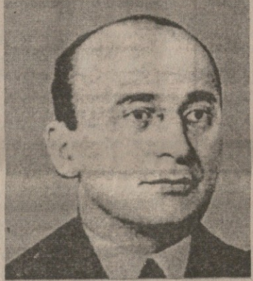
ხანი არავინ იცოდა, ყოველივე ამის შემდეგ თუ რა ბედი ეწია ბერიას ოჯახს.

1946 წელს, სსრ კავშირის მაშ- ინდელმა საგარეო საქმეთა მინს- ტრმა ვიჩესლავ მოლოტოვმა ნიუ იორკში, გაერთიანებული ერების ორგანიზაციის გენერალური ასამ- ბლეის ერთ-ერთ სხდომაზე თავის გამოსვლაში საგანგებოდ მიანიშნა: „ჩვენ უახლოეს დროში გვექნება