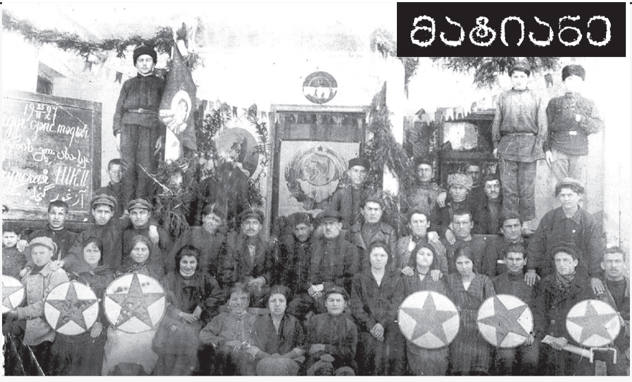
ახურის სკოლის მოსწავლეები და პედაგოგები, 1927 წელი, 25 თებერვალი, რაჭის უზენაესი სასწავლო ალგორითმი