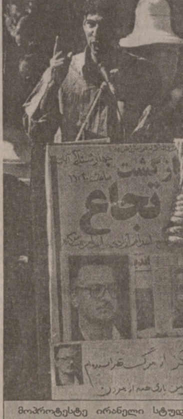
მოპროტესტე ირანელი სტუდენტები

რომლის თანახმადაც ალაჯარის ასცდება სიკვდილით დასჯა, თუ განცხადება დანერგა, რასაც ეს უკანასკნელი არ ეთანხმება, ხოლო უზენაესმა ლიდერმა — აიათოლა ხამანეიმ — მანამდე სცადა ჩაეცხრო მწვავე სიტუაცია იმით, რომ ბრძანა სასიკვდილო სასჯე-