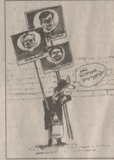
ხელისუფლების დამხობის გეგმა, რომლის განხორციელებაში მათ გარეგანი ძალები დაეხმარნენ.

ქართველი ხელხი ეროვნული დამოუკიდებლობის მოსაპოვებლად ორასი წელიწადი იბრძოდა და ემზადებოდა. ამ მზადებაში არსებითი წვლილი ლიტერატურის, ხელოვნებისა და უფრო გვიან მეცნიერების წარმომადგენლებმა შეიტანეს. ქართველმა ერმა ეს ამოცანა ბრწყინვალედ შეასრულა, მოიპოვა ნანატრი დამოუკიდებლობა. ამით დამთავრდა თავისუფლებისათვის ბრძოლის პირველი ეტაპი. დამოუკიდებლობის მოპოვების შემ-