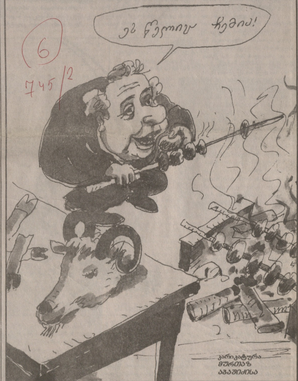
კარიკატურა მურთაზ აბაშიძისა

„რუსეთი თავისი ყველაზე ძვირფასი აგენტის - შევარდნადის ტოტალურ მოზილიზაციას ახდენს, თუნდაც მისი სრული „გამოფრვის“ ფასად. მას აიძულებენ, თავისი აგენტურული შესაძლებლობები ბოლომდე განახორციელოს ამ ეტაპზე, რადგან წინ სხვა „ეტაპი“ აღარ აქვს.“ მე-2 გვ.