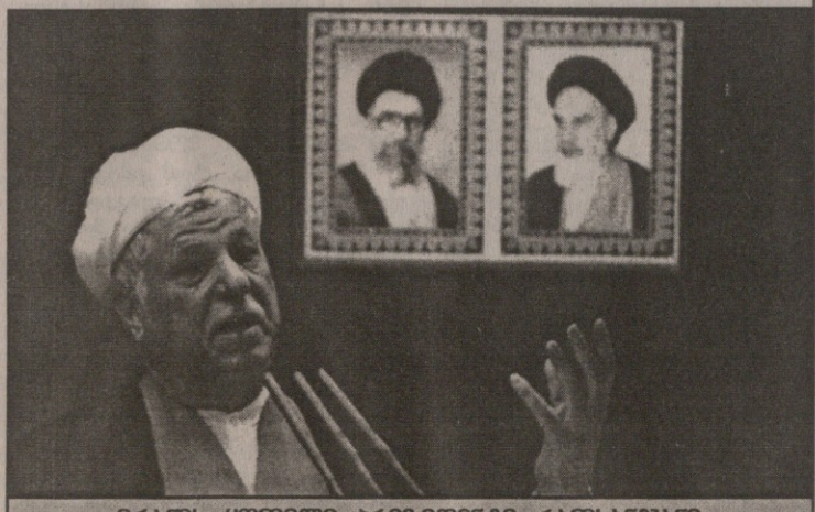
ირანის ყოფილი პრეზიდენტი რაფსანჯანი.

საქართველოს ტერიტორიას ამერიკული მხარე გამოიყენებს ირანის წინააღმდეგ სამოქმედოდ, ამას მოჰყვება ირანელთა საპასუხო დარტყმა საქართველოზე (უფრო ზუსტად: ირანის პოზიციის ის ინტერპრეტაცია, რომელსაც რუსული მასმედია და რუსული პოლიტიკური საზოგადოებრიობა იძლევა)? ამ კითხვებს, ერთის მხრივ, მარტივი პასუხი აქვს. პირველი ინიციატივა გამოთქმულია მხოლოდ რუსეთის ხათრით, რომლისგანაც ირანი მრავალმხრივად არის დამოკიდებული, მეორე პოზიცია კი ერთ-ერთი ელემენტია რუსეთის მიერ ომის პირდაპირი და არაპირდაპირი სიმულაციისა, რომ იგი მზადაა დასავლეთის გამონყევა მიიღოს