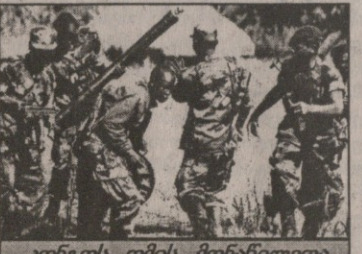
კონგოს ომის მონაწილეთა ჯგუფი.

ჯარისკაცების გაგზავნა. არის აზრი, რომ სამშვიდობო მისია დაეკისროს რეგიონულ სუპერძალას — ანგოლას, რომელსაც შედარებით ორგანიზებული და ბრძოლისუნარიანი არმია ჰყავს, მაგრამ ეს პროექტი გარკვეულ პოლიტიკურ შიშებს იწვევს კონფლიქტის სხვა მონაწილეებში და მეზობლებში. კონგო, როგორც სახელმწიფო, ფაქტობრივად დანანერვებულია. ხოცვა-ჟლეტას, განსაკუთრებით — მშვიდობიანი მოსახლეობის — უკიდურესად უწყალო, ბარბაროსული ფორმები აქვს. მკვლელობის მოტივებია ყაჩაღური სიხარბე, პოლიტიკური თუ სტრატეგიული ინტერესი, ტომობრივი სიძულვილი.