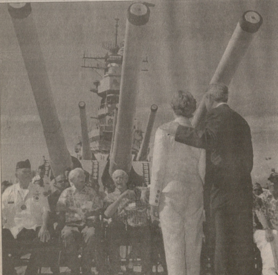
გაუი და მისი მეუღლე ჰედეზიან ვიტარანავს სახაზო სოფელ „გაისურია“.