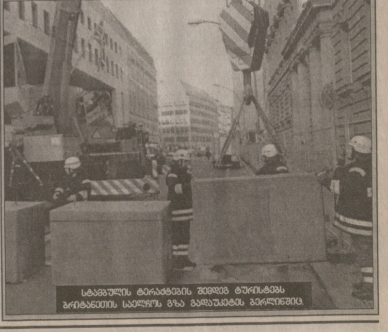
სტამბულის ტარაძევის შენობა ტურისტებს ჰქონდათ საფრთხის გზა გადაუკეტეს აპრილისთვის.

ჟურნალის სიტყვით, მრავალს ებადება კითხვა, ამერიკელთა ესოდენ ძლიერი შემოჭობება საერთაშორისო სისხლის სასამართლოს ამოქმედების გამო იმით ხომ არაა გამოწვეული, რომ მოსალოდნელია ამ სასამართლომ თავისი მოქმედების სფეროში შეიყვანოს „აგრესიის დანაშაულობაც“ (ანუ დანაშაული, რომელიც მდგომარეობს აგრესიის ჩადენაში), რაც შეაბრკოლებს ბუშის ადმინისტრაციის ბრძოლას „წინმსწრები დარტყმის“ ლეგალიზაციისათვის. ცოტანი ფიქრობენ, რომ ამერიკელები შეძლებენ ახალი სასამართლოს მოშლას, მაგრამ იმ აზრისა არიან, რომ ისინი შეძლებენ მის დისკრედიტაციას. სასამართლოს ერთ მაღალ თანამდებობის პირს დაუჩივლია: „მაქსიმუმში, რაც ჩვენ ამერიკელებისგან გვინდა, არის არაავთვისებიანი უგულებელყოფა. განა ეს ბევრია?“.