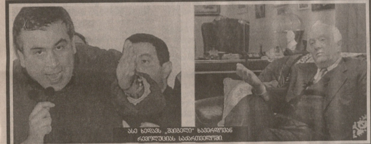
ასე ხელავს „ავიჯილი“ ხავერდოვან რეჟიმს სსაპრეზიუმში.

უფრო ღრმა წინააღმდეგობა იმალება იმაში, რომ 25 წევრ