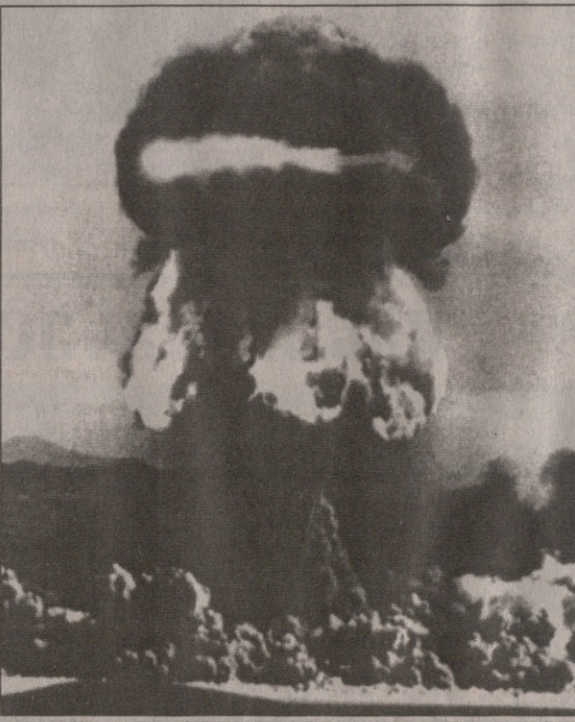
პირველი ბირთვული დაბომბვა

ბირთვული იარაღის ქონის უფლება — იძულებით, მაგრამ