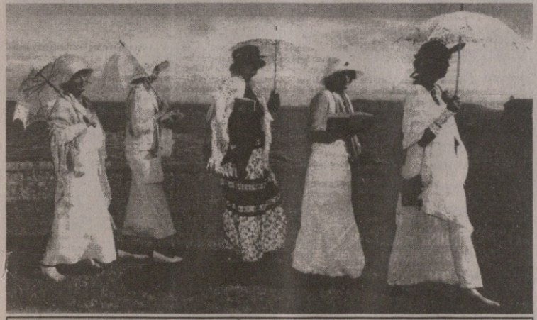
ჯეიმს ჯონსის დაბადების 100 წელი. მანდილოსნები კითხულობენ „ულისეს“

ადიანთა ნებაზე. იგი გარდუვალი შედეგია დედამიწის „შემჭიდროებისა“ ტრანსპორტისა და კომუნიკაციის საშუალებათა განვითარების წყალობით, აგრეთვე დედამიწის მიხლოებისა ადამიანებით „გავსების“ ან „გადავსების“ მდგომარეობასთან. ისტორიისათვის ცნობილ ვითარებებს არსებობისათვის ინდივიდების ბრძოლისა საზოგადოების შიგნით და საზოგადოებების (ქვეყნების, ერების...) ბრძოლისა კონტინენტის (რეგიონის...) შიგნით დაემატა ახალი (და, სავარაუდოა, შეუქცევადი) ვითარება: სახელმწიფოთა (ერთა) ბრძოლისა დედამიწის დასახლებული ნაწილის („მსოფლიოს“) შიგნით.