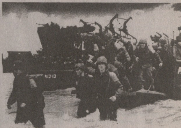
მეორე ფრონტის გახსნა. დესანტი ნორმანდიაში

ხელმოცარვა (FAILURE) პირდაპირ აზარალებს ინტერესთა ფართო სპექტრს, რომლებიც მოიცავენ ადამიანის უფლებათა დაცვას, კარგი მმართველობის მიღწევას, კანონის ბატონობას, რელიგიურ შემწყნარებლობას, გარემოს დაცვასა და აზიურული ინვესტიციებისა და ექსპორტი-ეკონომიკისათვის პირობების შექმნას იგი ხელს უწყობს რეგიონულ საშიშროებას, ი არ აღივსა გარეცხვებს, ნარკოტრაფიკს და ტერორიზმს... სახელმწიფოთა ვერ შედეგობის (ხელმოცარვის FAILURE) პრობლემისათვის პირველ ხარისხის ვაჭრობის მოკლება იმას ნიშნავს, რომ არეულობა გააგრძელებს გარეცხვებს მთელ აღმოსავლეთში, აფრიკაში, ანდების ქვეყნებში, სამხრეთ და ცენტრალურ აზიაში და სამხრეთ აღმოსავლეთ აფრიკის ნაწილებში... თუ აშშ და მათი მთავარი პარტ-