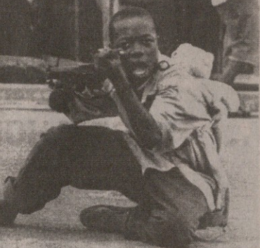
ეს ბავშვი დაქირავებული ჯარისკაცია

ვითარებას 20 წლის ასაკში აღწევს. რა შეიძლება ეშველოს ამ პრობლემას? დასავლეთმა ჯერ არაფერი მოიმოქმედა სამოქალაქო ომის შესაჩერებლად ისეთ ქვეყნებში, როგორცაა ლიბერია, სიერა ლეონე ან კონგო. ბავშვი ჯარისკაცების გამოყენებლბთან შეგონებით ვერაფერს გახდებით. სინგერის აზრით, მათ ძვირად უნდა დაუწვავთ ეს საქმე, თუნდაც დიდი სასჯელის დაკანონებით, როგორც