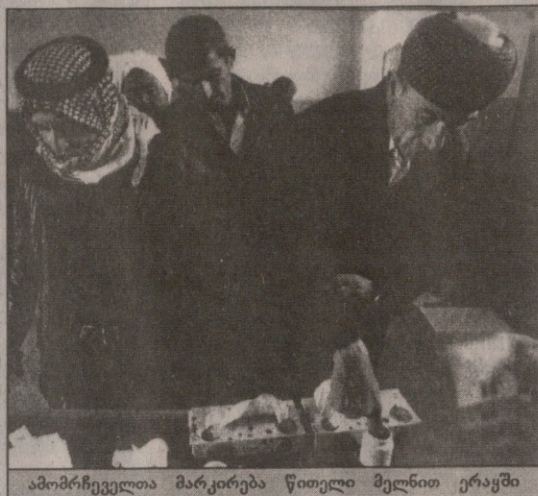
ამომრჩეველთა მარკირება წითელი მელნით ერაყში

იდენტის რაფსანჯანის მიმართ (იგი ამ არჩევნებზე ერთ-ერთი ფავორიტი იყო) და რეფორმისტი ინტელექტუალების მიმართ,