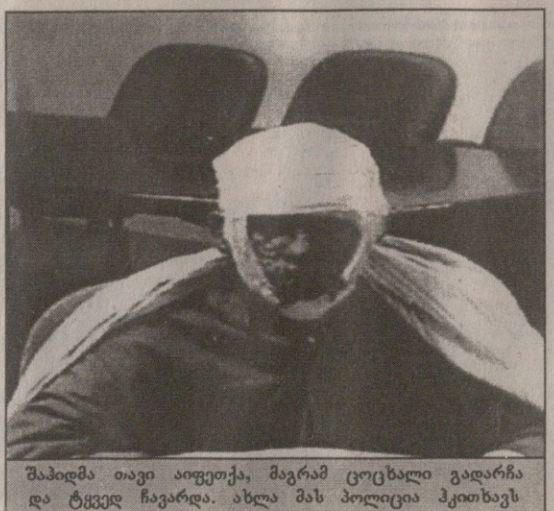
შაპიდმა თავი აიფეთქა, მაგრამ ცოცხალი გადარჩა და ტყვედ ჩაგარდა. ახლა მას პოლიცია ჰკითხავს