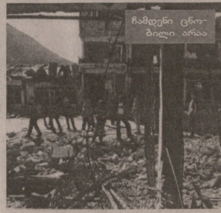
ჩამდენი ცნობილი არაა

იქნობს ერთ-ერთ ექვმიტანილს, როგორც „კარგ კაცს“. ორი სხვა ექვმიტანილი — ერთი სერჟანტი და ერთი უმცროსი ოფიცერი — პატიმრობიდან გაათავისუფლეს 13 ნოემბრის სასამართლომდე. ეს ორნი ამბობდნენ, მხოლოდ იმიტომ გაეწერდით მეჩეთთან, რომ მომარდგა გვინ-