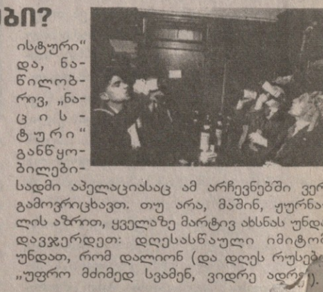
ისტური“ და, ნაწილობრივ, „ნაციონალური“ განწყობილები-სადმი აპელაციასაც ამ არჩევნებში ვერ გამოვრცხავთ. თუ არა, მაშინ, უფრო ნათელია აზრით, ყველაზე მარტოვანსა უნდა დავეჯერდეთ: დღესასწაული იმიტომ უნდა, რომ დალიონ (და დღეს რუსებს „უფრო მძიმედ სვამენ, ვიდრე ადრე“).

The Economist-ის კითხვა ეხება 7 ნოემბრის მაგიერ 4 ნოემბრის დღესასწაულობას, როგორც „ხალხის ერთობის დღისა“. რატომ? უფრო ნათელი ვარაუდობს, რომ ეს არის წლისათვის 1612 წლისა, როცა მოსკოვიდან პოლონელი დამპყრობლები გააგდეს და „შფოთიანი დრო“ რომანოვების გამეფებამ და სტაბილიზაციამ შეცვალა. პირველი ასახიერებს ელცინის დროს, მეორე — პუტინისას. მთელი ეპიზოდის გახსენება წიკოპურტია პოლონელებისთვის, რომლებთანაც რუსებს ამჟამად „მეტად არაცივილური“ დამოკიდებულება აქვთ. მასების „ნაციონალ-