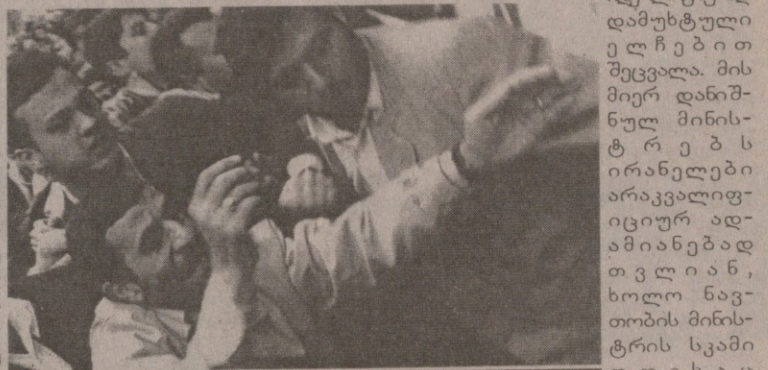
ირანის პრეზიდენტი მიზეთისკენ მისწრაფვის

„თუ ალიევი არ გადაადგდეს“, მაშინ, ურუნალის აზრით, ქვეყნის მომავალი დამოკიდებული იქნება იმაზე, თუ როგორ მოიქცევა განათლებული (Enlightened). ეს ის სიტყვაა, რომელიც ინგლისურ ენაში გამოყენებულია განათლებული აბსოლუტურიზმის აღსანიშნავად) ბ-ნი ალიევი“. აზერბაიჯანი ბაქოს მიღმა, კორესპონდენტის ცნობით, სულ სხვაა, ვიდრე ბაქო, რის აღსაქმელადაც საკმარისია დედაქალაქიდან 20 კმ-ის მანძილზე მდებარე პატარა ქალაქის და მის ცნობილ სალოცავში ჩადროსანი ქალების ნახვა. აქედან ჩანს, რომ ნავთობის ფული მასამდე არ მიდის. ჯამური შეფასებით, „გეოგრაფია და მუსლიმანური მოსახლეობა (8 მილიონი სული. რედა.) არ ხდის აზერბაიჯანში ისლამისტურ ამბოხებას უფრო გარდუვალს, ვიდრე მისი გაყალბებული არჩევნები გარდუვალს ხდის რევიოლუციას. ამბობენ, აზერბაიჯანელები მეტრისმეტად პრაქტიკული არიან იმისათვის, რომ ექსტრემიზმში არ გადავარდნენ. შესაძლებელია, მაგრამ თუ ის დიდი ფული, რომელიც ნავთობიდან და გაზიდან შემოვა მოკლე ხანში, ჭკვიანურად არ იქნება გამოყენებული, ერთ მშვენიერ დღეს რაღაც მოხდება“.