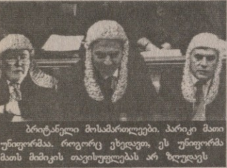
ბრიტანელი მოსამართლეები. პარიკი მათი უნიფორმა. როგორც ვხედავთ, ეს უნიფორმა მათს მიმართ თავისუფლებას არ ზღუდავს

ფლორ დაში ასა- მართლებ- ბენ არაბულ- ლი წარ- მოშობის პროფე- სორს სამი არიანს, რომელიც ცნობილია ამერიკული პოლიტიკის გააფთრებული კრიტიკით და იზრავის სიძულელია. ბრაღად ედება, რომ ფულს აგროვება ქველმოქმედებისათვის და გადასცემდა ტერორისტულ ორგანიზაციებს. ბრაღად სცნო 17-მა ნაფიცმა მსაჯულმა და უბრალოდ — ცხრამ, რაც არ კმარა ბრაღებისათვის. იგი ჯერჯერობით ციხეში რჩება, მთავრობა კი ახალ გასამართლებას გეგმავს. მისი სამი თანამოსამართლე მისი მხარეზეა და ცხრამ მთავარი არგუმენტი პროფესორის სასარგებოდ ისაა, რომ კაცი შეიძლება გასამართლოთ მხოლოდ მისი ქმედებებისათვის, მაგრამ არა მისი შეხედულებებისათვის. ქალაქ ტამპაში, სადაც მას ასამართლებენ, საზოგადოებრივი აზრი მას ცუდად ეკიდება. იზრავიდან აუარებელი ტერაქტის მსხვერპლები (დაზარალებულები) არიან ჩაფრენილი, კონსერვატორები რეკავენ ადგილობრივ რადიოსადგურებში და ითხოვენ მისი ნაწილობრივ გამამართლებელი ვერდიქტის გადასინჯვას. ერთმა მსაჯულმა თქვა, „ჩვენ ვერ მოვიფიქრეთ, რომ მთავრობა თავის საქმეს აკეთებდა“.