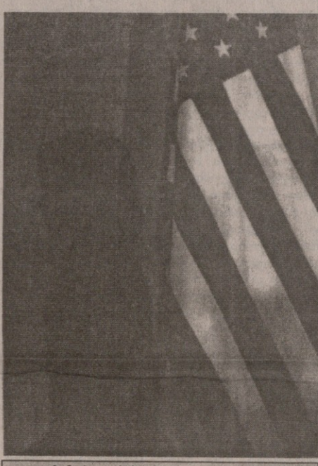
„უსამართლობის ჩრდილი არ ქრება“

ნის, თუ როგორ თავსდება წამების უფლება პრეზიდენტის უფლებამოსილება ჩარჩოში ომის დროს. გაზ. „უოშინგტონ პოსტში“ გამოქვეყნებული მასალა, რომლის თანახმადაც დაზვერვის ცენტრალურ სააგენტოს აქვს საპატიმროთა ძეგლი, სადაც მას შეუძლია ადამიანები იყოლიოს გაურკვეველი ვადით და საიდუმლოდ, მხოლოდ ზრდის იმ ეჭვს, რომ ბ-ნი ჩეინის ჰსურს, ამ სააგენტომ დაიკანონოს „გაძლიერებული დაკითხვის ტექნიკა“. ეს ტექნიკა მოიცავს „წყალში მოთავსებას“ (Water-BOARDING) ანუ კაცისათვის შთაბეჭდლების შექმნას, რომ იგი წყალში იხრჩობა, თუმცა ბ-ნი ჩეინის, უფრო ნათელი სიტყვით, „ერთი ადგილი არ ეყო“ (Had Not a Gut), რათა ეს აზრი საჯაროდ გაეცხადებინა. არგუმენტაცია, წამება ზოგჯერ გამართლებულია, დღეს უყურადღებოდ დასატოვებელი არ არის. უფრო ნათელი კითხვას ადამიანური განზომილების პლანში სვამს და მას ასე აფორმულებს: ვთქვათ, ვინმე მოჰამედი პატიმრად გვყავს