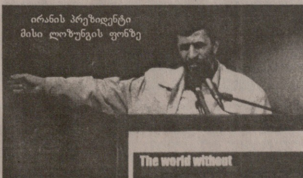
ირანის პრეზიდენტი მისი ლოზუნგის ფონზე

ისეთი ეფექტიანია, როგორც ურთიერთშეთანხმებული და ერთ „გრაფუსზე“ დაყენებული გამოსვლა. უფრანალის დაკვირვებით, ირანში „არც პროგრამებია, არც ადამიანები არიან“, ვისაც დღეს მასის „გაღვანიზირება“ შეეძლოს. რეფორმისტები კიდევ გაოგნებული არიან მათი იმედის — პრეზიდენტ ხატამის ჩასვენებით პოლიტიკის ციდან. „ისეთ