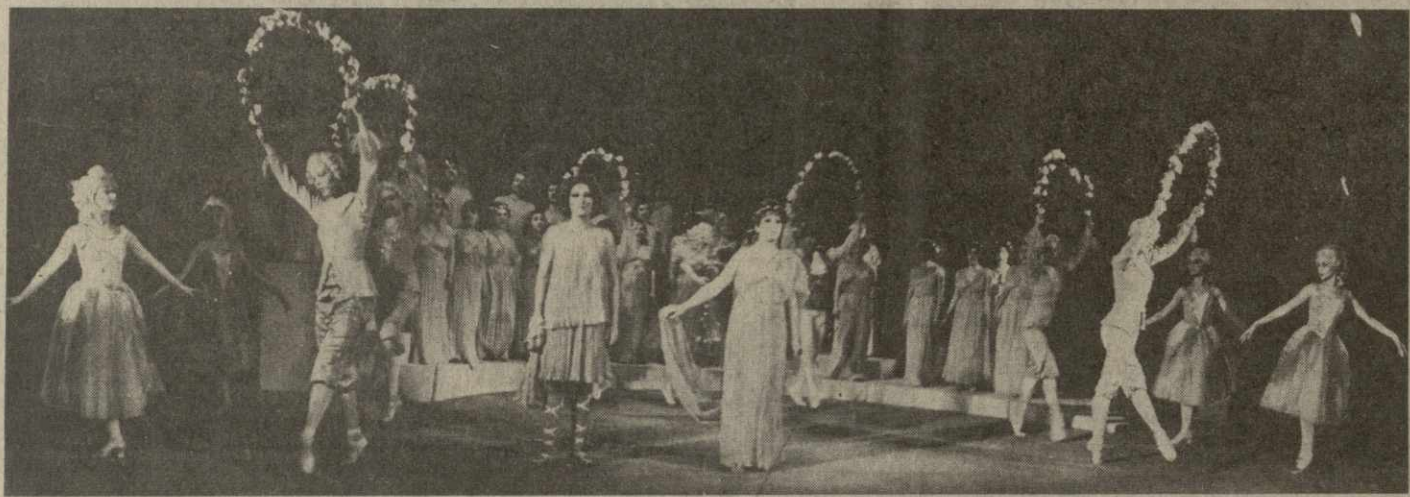
На снимке: сцена из спектакля.