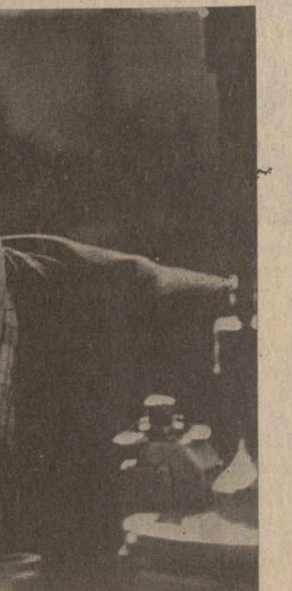
Делегат XXVI съезда КПСС

себе славу мастера-профессионала. Сегодня он уже и наставник.