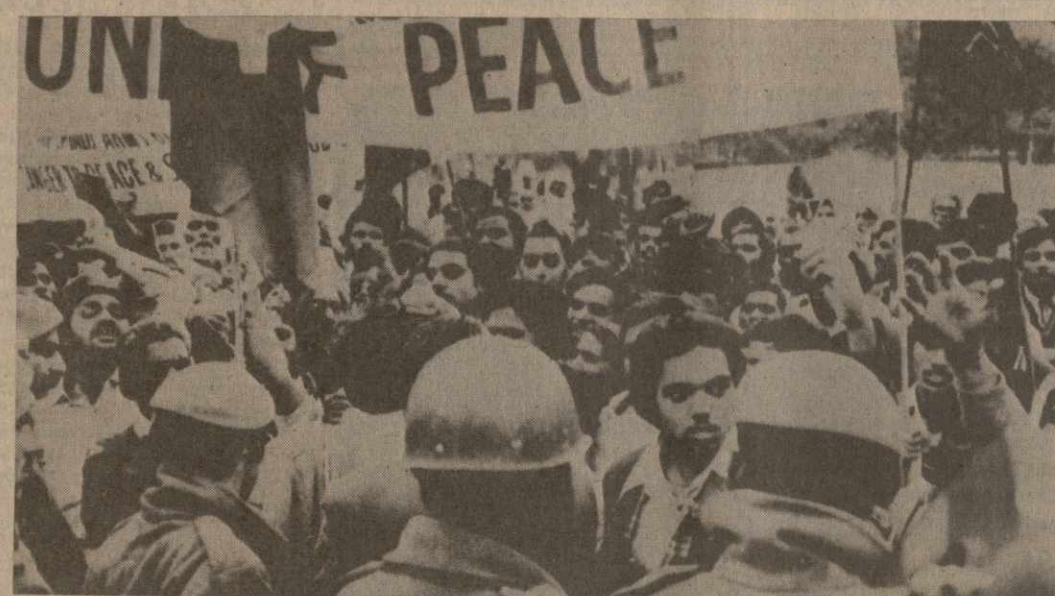
«Долой военные базы США из района Индийского океана!», «Превратить Индийский океан в зону мира!» — под такими лозунгами в Дели состоялась демонстрация протеста индийской общественности против наращивания американского военного присутствия в Азии.

Все это говорит о том, что в стране не только отсутствуют «единство, сплоченность, общность и законность», обещанные китайскими лидерами, но, наоборот, происходит дальнейшее социальное расслоение, усиливается по-прежнему пытаясь решить жизненно важные социально-экономические проблемы на путях сохранения несомненно модифицированного маоизма, породившего эти проблемы.