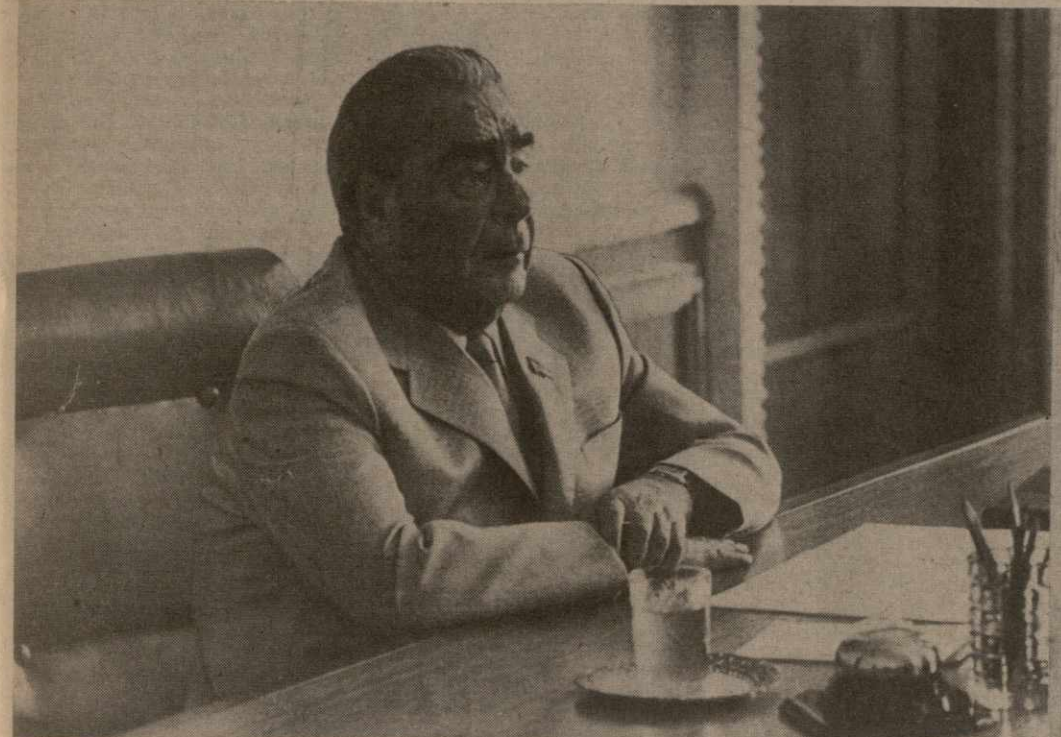
Во время совещания.

საპარტიო ჯგ ცენტრალური კომიტეტის საპარტიო სსრ უბნის საპარტიო საპარტიო სსრ ბინოსთან საპარტიო ობიექტი