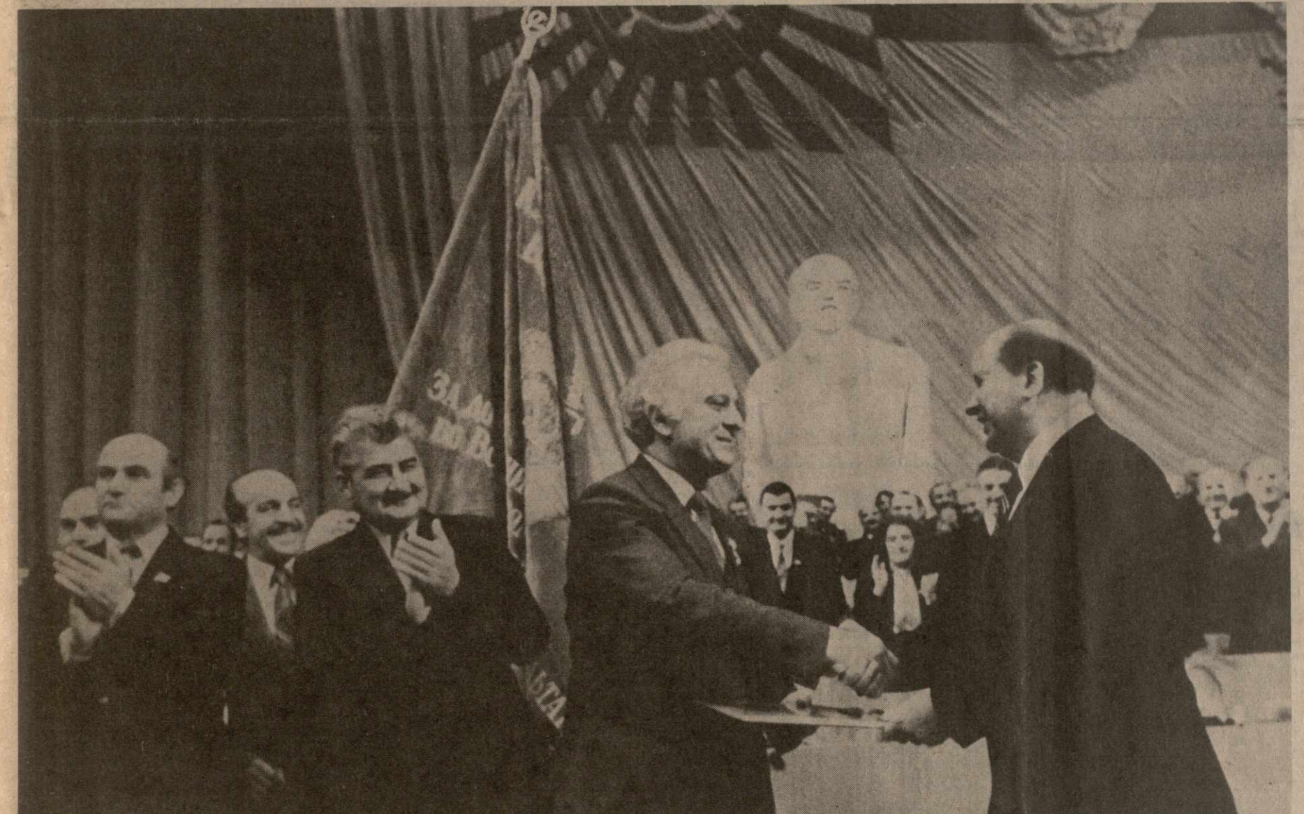
Во время вручения Грузинской ССР переходящего Красного знамени ЦК КПСС, Совета Министров СССР, ВЦСПС и ЦК ВЛКСМ.

Для участников собрания партийно-хозяйственного актива республики был дан большой концерт с участием мастеров искусств и коллективов художественной самодеятельности республики.