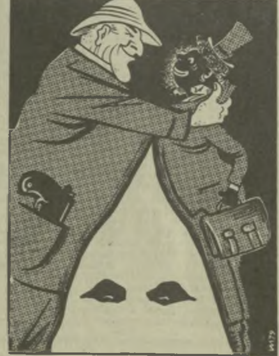
РОДЕЗИЙСКИЙ АЛЬЯНС. Рис. И. Иоселиани.

Международная реакция совместно с расистами ЮАР поддерживает родезийских марионет, предавших интересы народов Юга Африки в их борьбе против колониализма, расизма и апартаида. Словно разъяренная премудрости дипломатической игры покровителя расистов в конгрессе, требующим немедленного признания маринетки, составители доклада вынуждены отметить «изъяны» режима, которые мешают Вашингтону идти на такой шаг в настоящее время. Среди них — сохранение в стране осадного положения, политические репрессии против оппозиции, аресты, налеты на соседнюю Замбию. Тем не менее в Африке выражают озабоченность политикой Англии и США, рассматривая ее как стремление одобрить нынешнюю конституционную и политическую структуру в Родезии.