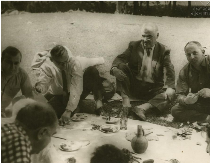
ექსკურზიაზე, ჩარგალში. 10 ივნისი, 1967.