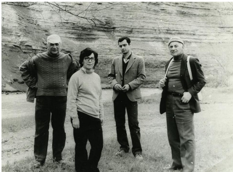
ვერეს ხეობაში. მარტი, 1986