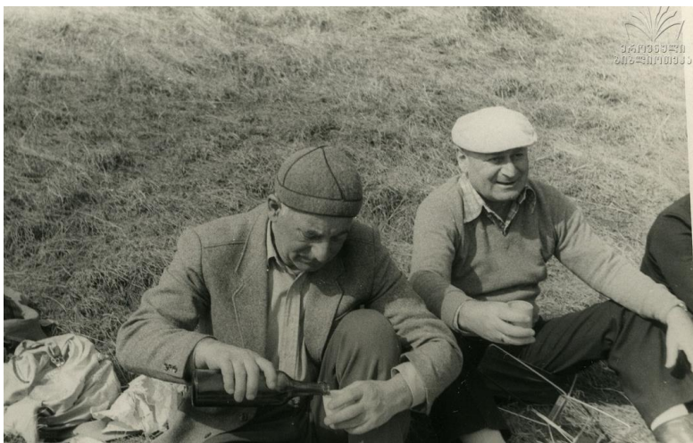
ვერეს ხეობაში. მარტი, 1986