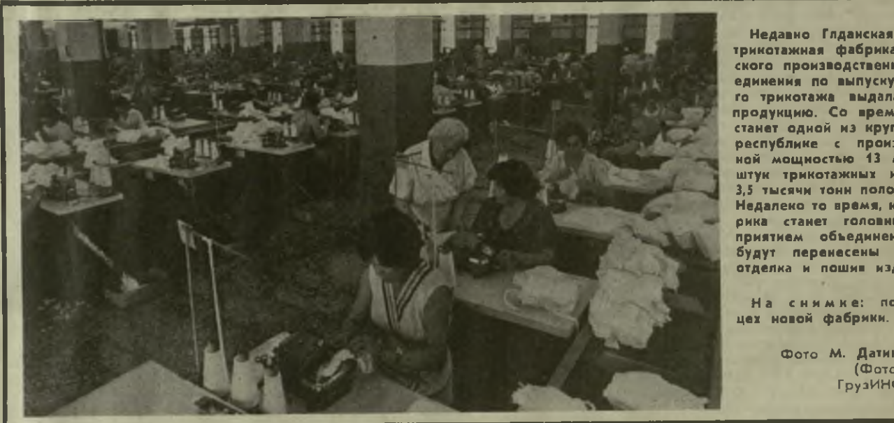
Недавно Гданская швейно-трикотажная фабрика Тбилисского производственного объединения по выпуску бельевых трикотажных изделий первую продукцию. Со временем она станет одной из крупнейших в республике с производственной мощностью 13 миллионов штук трикотажных изделий и 3,5 тысячи тонн полотна в год. Недалеко отсюда, в районе фабрики, будет организованное предприятие объединения, сюда будут перенесены крашенье, отделка и пошив изделий.