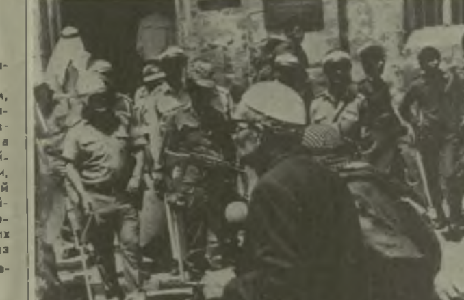
Израильские власти усиливают террор и репрессии против арабского населения и палестинских патриотов, протестующих против политики аннексии захваченных арабских земель. На снимке: оккупанты готовы к расправе. (Фотокроника ТАСС).

ТЕГЕРАН, 24 сентября. (ТАСС). Бюро революционных программ Ирана опубликовало доклад об основах социально-экономического развития страны на ближайшие 22 года. В нем указывается, что экономика Ирана будет включать в себя три сектора: частный, государственный и смешанный. Частному сектору отдаются мелкие и средние предприятия, смешанному — средние и крупные объекты, государственно-