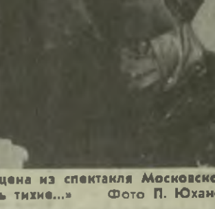
На снимке: сцена из спектакля Московского театра драмы и комедии на Таганке «А зори здесь тихие...»