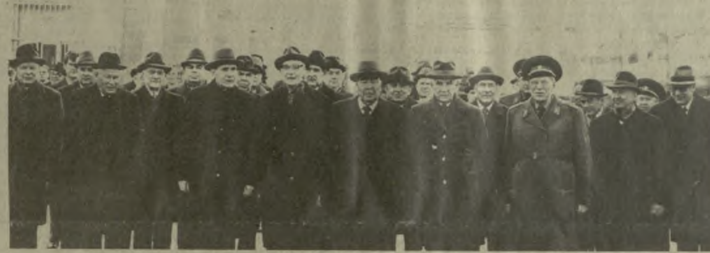
Во время проводов на аэродроме.