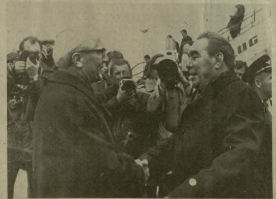
Во время встречи Л. И. Брежнева в аэропорту Шенефельд.

Товарищи Л. И. Брежнев и Э. Хонекер обходят строй почетного караула. По пути следования советской делегации в отведенную резиденцию ее радушно приветствовали десятки тысяч берлинцев.