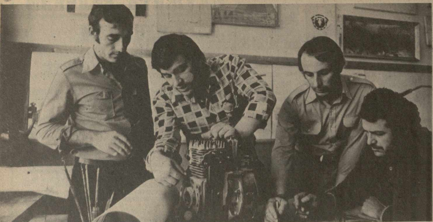
ПАРТИЙНАЯ ЖИЗНЬ: ОТЧЕТЫ И ВЫБОРЫ