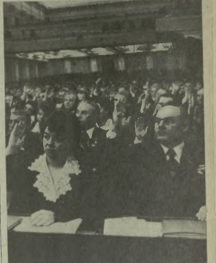
На снимке: на совместном заседании Совета Союза и Совета Национальностей Верховного Совета СССР.