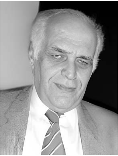
(დასაწყისი „სა“ №9. 2023)