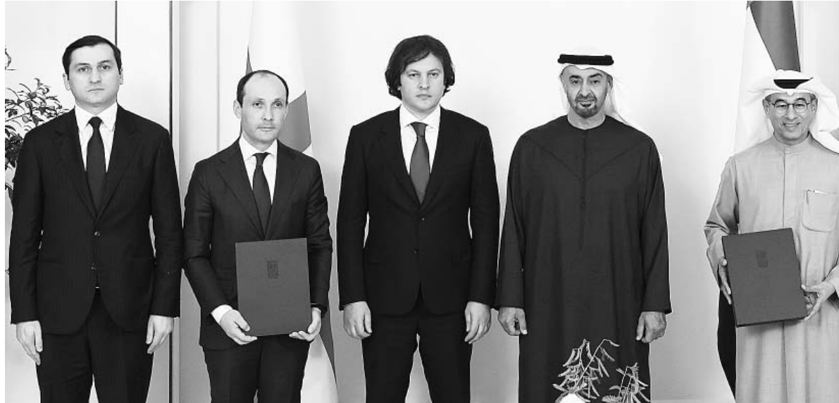
სებების მონაწილეობა ჩვენი ეკონომიკის კვლავწარმოებაში სამჯერ მეტი იყო.

— ზოგადად, ბიზნესის მთავარი დატვირთვაა, შექმნას დოვლათი და მიიღოს სარგებელი როგორც თავისთვის, ისე საზოგადოებისთვის. როცა ბიზნესის გაფიცვას წმინდა პოლიტიკური სარჩული უდევს, ეს კონტრპროდუქტიულია ბიზნესისთვისაც და საზოგადოებისთვისაც. მაგალითად, 2024 წლის დეკემბერში გაფიცვების და სხვა მიზეზთა გამო, ტურისტული ნაკადის შემცირებისა და სარესტორნო-სასატუმრო ბიზნესის შედარებით ნაკლებად დატვირთვის გამო, საქართველოს ეკონომიკამ, დაახლოებით, 300 მილიონ ლარამდე დამატებული ღირებულება ვერ აწარმოა. ამიტომ ყველაფერი უნდა გაკეთდეს, რომ ეკონომიკა პოლიტიკურ ვნებათაღელვებისგან მაქსიმალურად დაცული და მოშორებული იყოს.