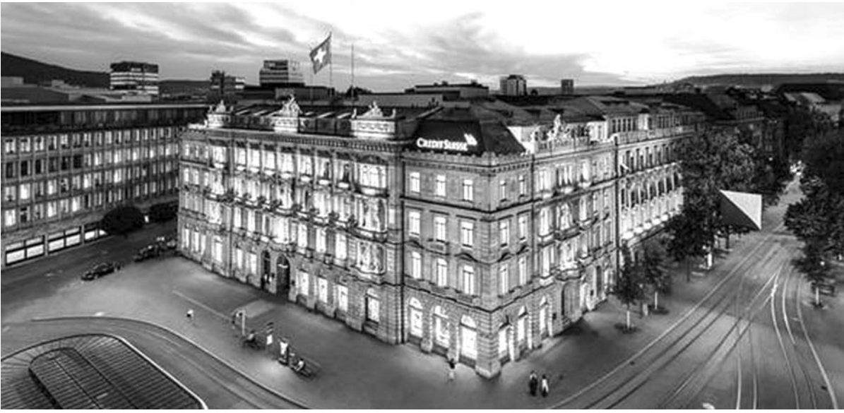
(დასასრული. დასაწყისი „სა“ N3)